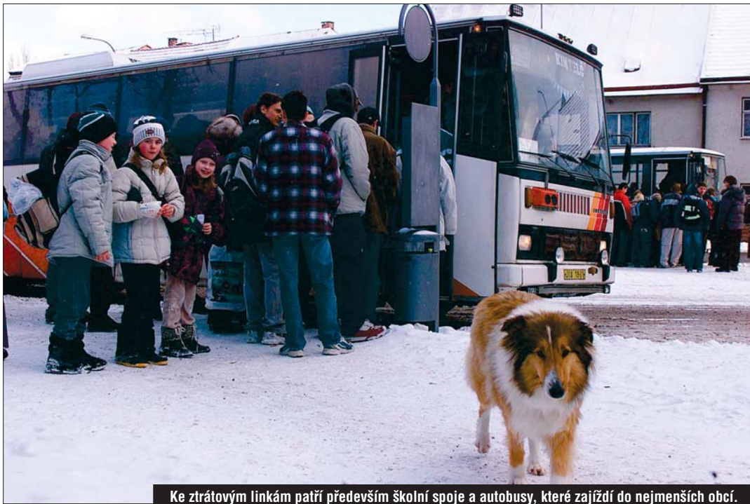
Ke ztrátovým linkám patří především školní spoje a autobusy, které zajíždí do nejmenších obcí.

Roční dotace dopravcům je 240 milionů korun. Na ní se zmíněnými 202 miliony podílí kraj a zbylými 38 obce. Loni a letos tedy kraj platí většinu autobusů na svém území a pro obce to znamená podstatné úspory z obecních rozpočtů. „Procento úspory je u každé obce jiné, ale v průměru se pohybuje kolem 50 procent peněz, které obce za autobusy platily před vznikem kraje. Některé radnice daly ušetřené peníze na další spoje, jiné částku použily