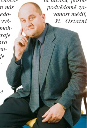
František Dohnal, hejtmán kraje Vysočina

K vydávání těchto krajských novin nás vedly stejné důvody jako obce a města, které vydávají pro své spoluobčany různé radniční zpravodaje. Do klasických deníků a občasných se většinou nedostanou všechny informace, které jsou pro občany důležité a zajímavé a které se týkají jejich bezprostředního okolí. Prvním důvodem je většinou širší záběr zpravodajství a komentářů, než jen pro jednu obec, v případě deníků pak obvykle záběr celostátní, byť některé mají regionální přílohy. Krajské noviny se tedy budou věnovat dění na Vysočině, občas doplněné zprávami z ostatních krajů pro porovnání, co se povedlo jinde. A tím se dostáváme ke druhému důvodu. V novinách, které kupujete na stáncích nebo které máte předplacené, v televizi a nakonec i v různých rádích se všichni setkáváme spíše s negativními zprávami, s tím, co má alespoň zdání senzace. Není to chyba novinářů, jak by se mohlo zdát. Je to důsledek psychologie a chování lidí. Senzace je pro nás jímavější než ostatní zprávy a sledovat, která přináší více senzace, je vyšší diváků, posluchačů a čtenářů. Senzace je pro nás jímavější než ostatní zprávy a sledovat, která přináší více senzace, je vyšší diváků, posluchačů a čtenářů. Senzace je pro nás jímavější než ostatní zprávy a sledovat, která přináší více senzace, je vyšší diváků, posluchačů a čtenářů.