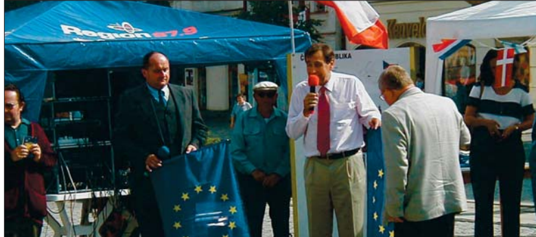
Evropský den v červnu na jihlavském náměstí. Hejtmán František Dohnal, tehdejší vyslanec Evropské komise v ČR Ramiro Cibrián a jihlavský primátor vysvětlovali před referendem, co vstup do Evropy pro obyvatele Vysočiny znamená.