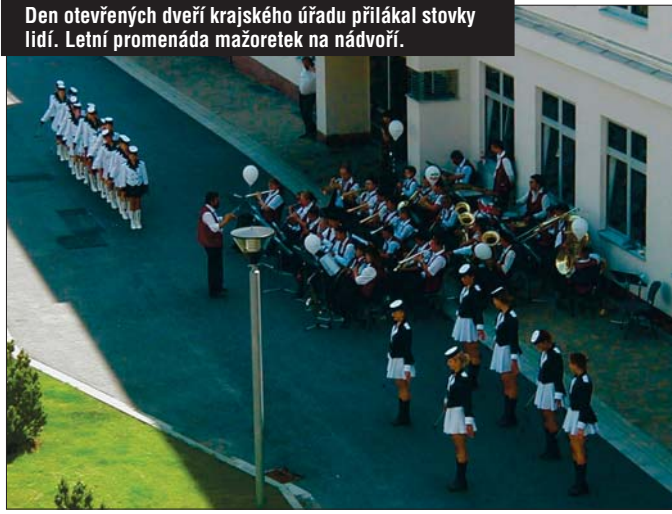
Den otevřených dveří krajského úřadu přilákal stovky lidí. Letní promenáda mažoretek na nádvoří.