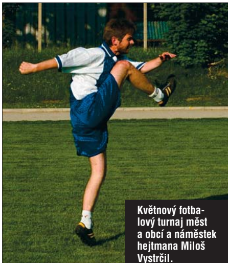
Květnový fotbalový turnaj měst a obcí a náměstek hejtmána Miloš Vystrčil.