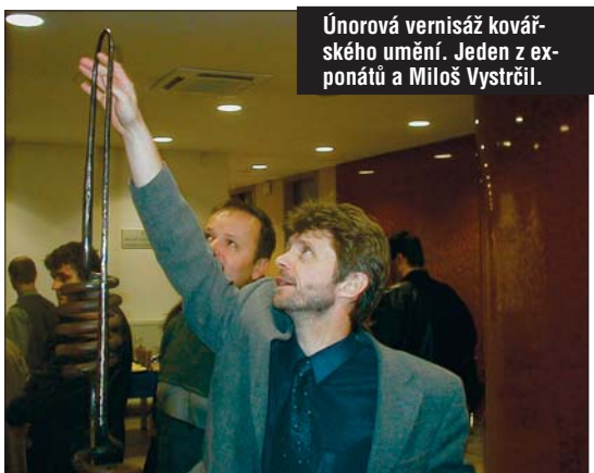
Únorová vernisáž kovářského umění. Jeden z exponátů a Miloš Vystrčil.