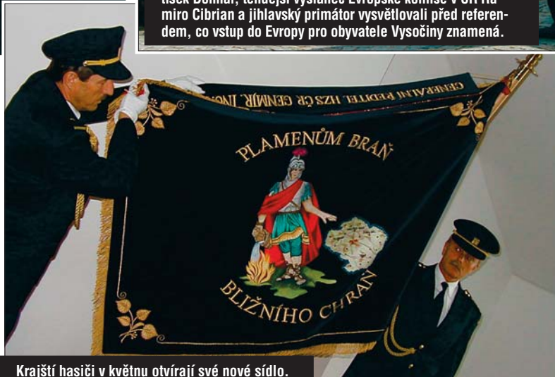
Krajští hasiči v květnu otvírají své nové sídlo.