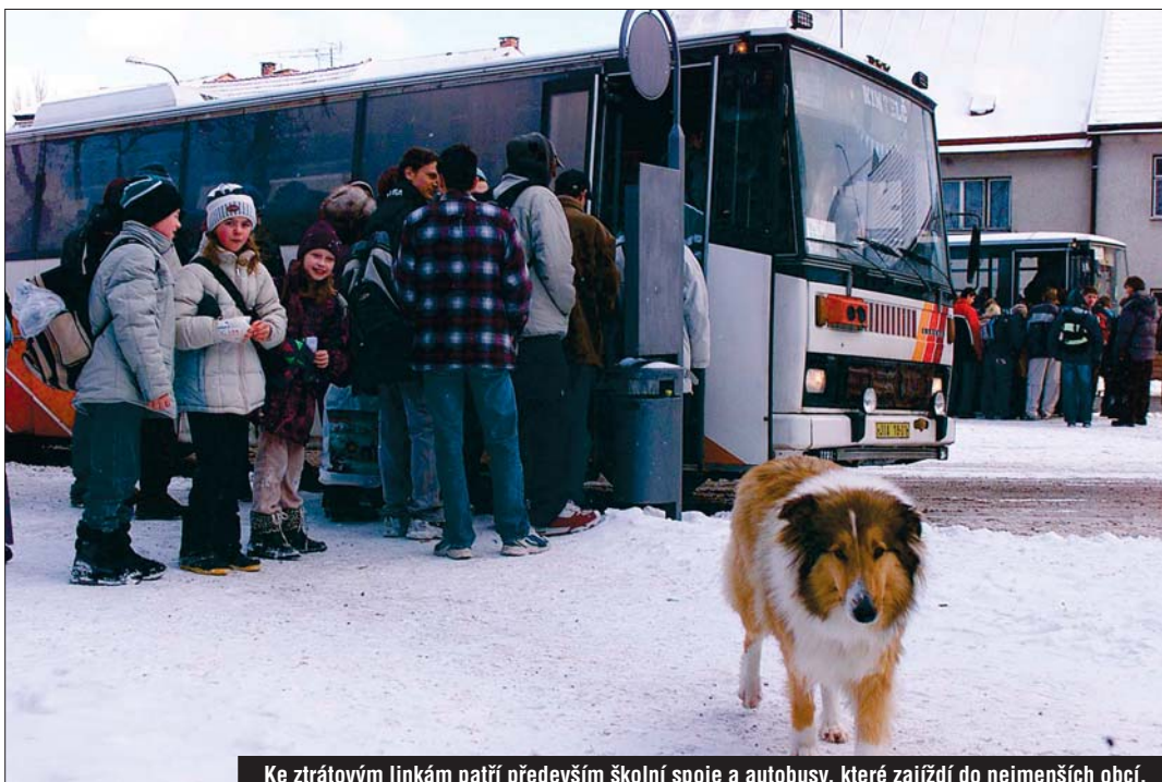
Ke ztrátovým linkám patří především školní spoje a autobusy, které zajíždí do nejmenších obcí.

Roční dotace dopravcům je 240 milionů korun. Na ní se zmíněnými 202 miliony podílí kraj a zbylými 38 obce. Loni a letos tedy kraj platí většinu autobusů na svém území a pro obce to znamená podstatné úspory z obecních rozpočtů. „Procento úspory je u každé obce jiné, ale v průměru se pohybuje kolem 50% peněz, které obce za autobusy platily před vznikem kraje. Některé obce použily ušetřené peníze na nasmlouvání dalších spojů, některé ušetřené peníze