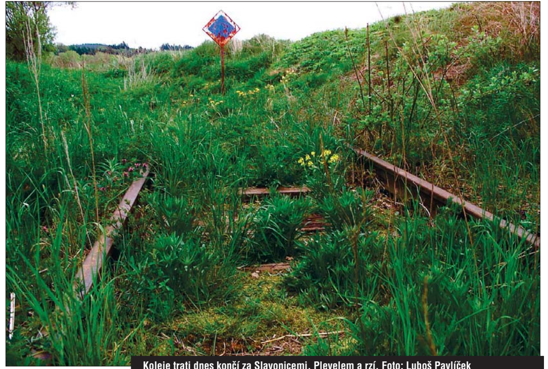
Koleje trati dnes končí za Slavonicemi. Plevelem a rzí.

Stavba bude stát asi 300 milionů korun, z toho asi na desetinu přijde český úsek. Ministerstvo dopravy a Státní fond dopravní infrastruktury prý s takovou investicí budou