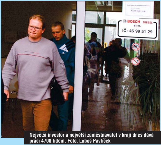
Největší investor a největší zaměstnavatel v kraji dnes dává práci 4700 lidem.

Největším investorem na Vysočině je jihlavský strojírenský podnik Bosch Diesel. Ten v kraji zatím vydal přes 13 miliard korun a nyní zaměstnává 4700 lidí. Významný příliv financí je spojen i s budováním firem výrobců autodílů Zexel Valeo v Humpolci na Pelhřimovsku, havlíckobrodské Futaby, výrobce dřevotřískových desek Kronospan v Jihlavě, nebo pily Stora Enso Timber ve Žďirci nad Doubravou.