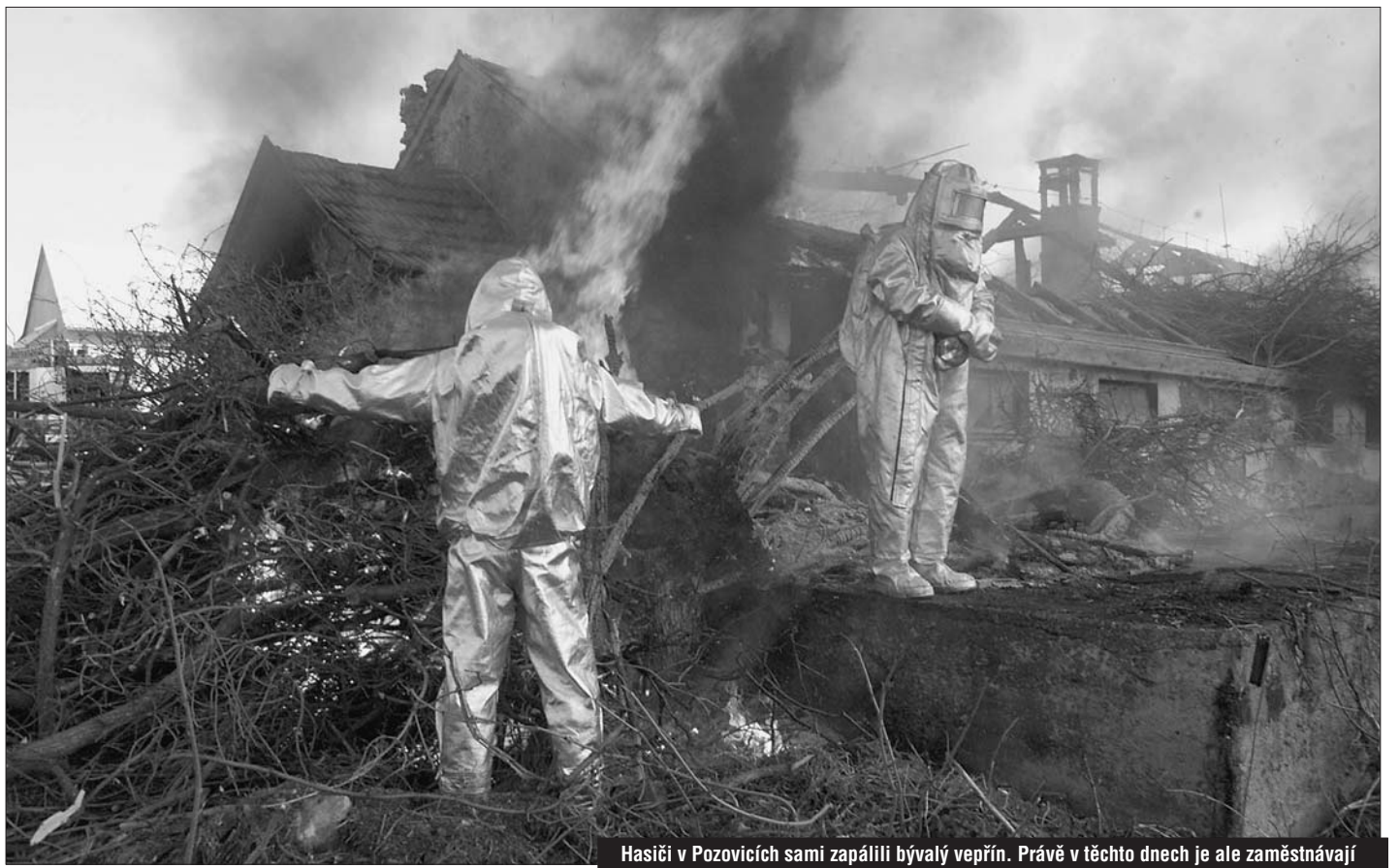
Hasiči v Pozovicích sami zapálili bývalý vepřín. Právě v těchto dnech je ale zaměstnávající požáry při vypalování trávy a lesních pracích.

Počet požárů se loni kvůli dlouhému suchu oproti roku 2002 zdvojnásobil. Hasiči likvidovali 1078 požárů a oheň pohltil majetek za více než 95 milionů korun. Plameny zmařily deset lidských životů, zraněno bylo 44 lidí a 22 hasičů. Jednotky loni zasahovaly u 6127 mimořádných událostí, zachraňovaly lidi i majetek při záplavách, dopravních nehodách na silnicích, dálnici i železnici. Na Vysočině je 21 jednotek profesionálních hasičů kraje, tři podnikové a 892 jednotek dobrovolných hasičů v obcích.