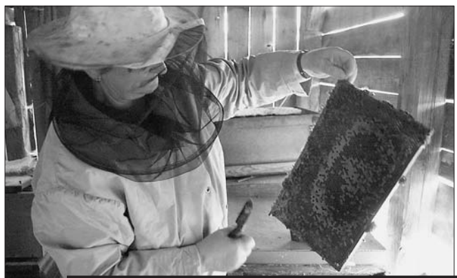
V roce 2002 bylo na Vysočině 43.621 včelstev, loni v květnu už jen 30 tisíc.

hou nyní včelaři dostat od kraje jako přímou dotaci na jednu soupravu. Každá základní organizace Českého svazu včelařů může požádat o peníze na jednu soupravu na každých 300 včelstev, maximálně ale na tři soupravy. „Ekonomický význam včel spočívá zejména v tom, že jsou hlavním opylovačem, a proto je důležité, aby se včelstev v kraji zachovalo co nejvíce,“ obhajuje peníze pro včelaře radní pro životní prostředí Ivo Rohovský (ODS). Včelám na Vysočině zasadila ránu zejména minulá zima, kdy zde uhynulo 32 procent včelstev, to je o devět procent více než je republikový průměr.