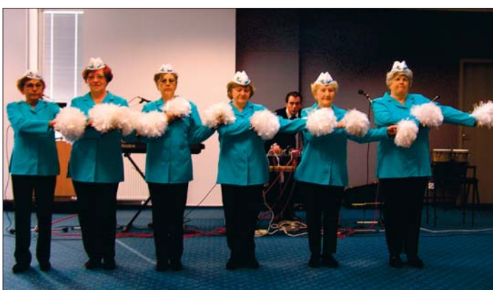
Nejstarší české mažoretky jsou z Mostu a sluší jim to.