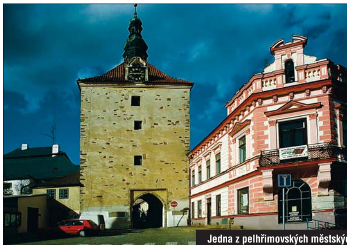
Jedna z pelhřimovských městských bran.

Tento výlet vyváženě kombinuje procházky v přírodě s poznáváním historických míst a nabídne Vám nevěšdně pestrou paletu významných pozoruhodností.