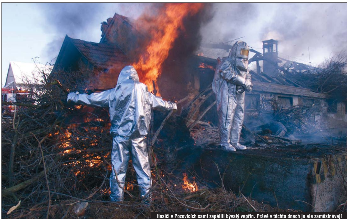
Hasiči v Pozovicích sami zapálili bývalý vepřín. Právě v těchto dnech je ale zaměstnáván požáry při vypalování trávy a lesních pracích.

Velké sucho bylo loni příčinou dvojnásobného počtu požárů. Hasiči zachránili miliardové hodnoty.