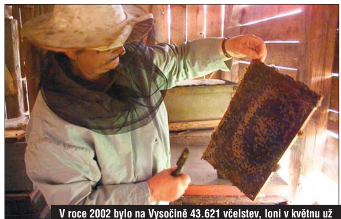
V roce 2002 bylo na Vysočině 43.621 včelstev, loni v květnu už jen 30 tisíc.

hou nyní včelaři dostat od kraje jako přímou dotaci na jednu soupravu. Každá základní organizace Českého svazu včelařů může požádat o peníze na jednu soupravu na každých 300 včelstev, maximálně ale na tři soupravy. „Ekonomický význam včel spočívá zejména v tom, že jsou hlavním opylovačem, a proto je důležité, aby se včelstev v kraji zachovalo co nejvíce,“ zdůvodňuje peníze pro včelaře radní pro životní prostředí Ivo Rohovský (ODS). Včelám na Vysočině zasadila ránu zejména minulá zima, kdy zde uhynulo 32 procent včelstev, to je o devět procent více než republikový průměr.