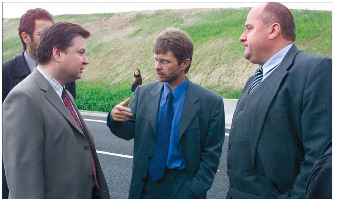
Slavnostního otevření obchvatu se zúčastnili (zprava v pořadí) hejtmán František Dohnal a jeho první náměstek Miloš Vystrčil. Stavba je totiž důležitá pro dopravu v celém kraji.

výhledovku na Znojmo do jednoho velkého okruhu. Úsek by měl být bezmála tři kilometry dlouhý a podle předpokladů si vyžádá půl miliardy korun a dva roky práce. Jeho trasa ale vyvolala protesty občanů Písto, kteří by rádi viděli obchvat dál od svých domů.