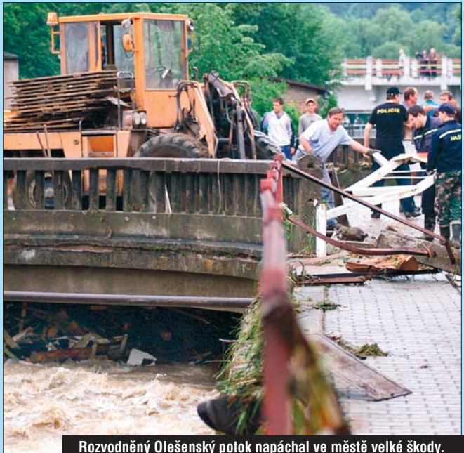
Rozvodněný Olešenský potok napáchal ve městě velké škody.

Velká voda vtrhla do Ledče 10. června a způsobila škody za zhruba 35 milionů korun. Aby se podobná situace neopakovala, připravilo město návrh protipovodňových opatření, mezi které patří poldr, zásady hospodaření na okolních zemědělských pozemcích a přestavba mostků a dalších staveb na Olešenském potoce.