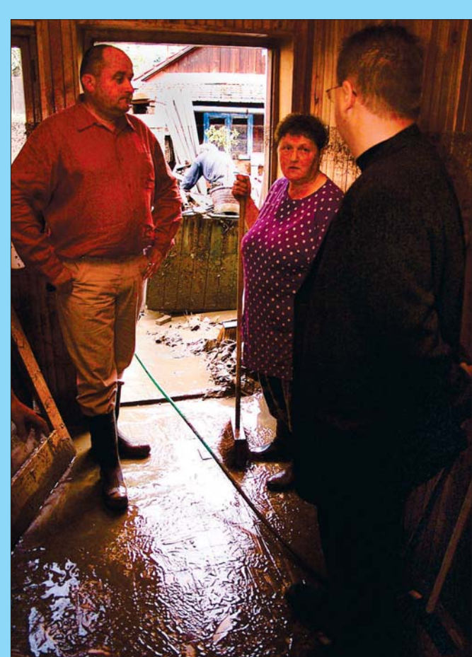
Hejtman viděl následky povodně

ší, než celostátní zisk. Naopak nejhůře ODS dopadla na Třebíčsku se ziskem 22,54 procent hlasů. KDU-ČSL má nejvyšší voličskou podporu na Žďársku, kde vysoko předstihla komunisty a získala 23,46 procenta hlasů. Pelhřimovsko lidovcům přiklo nejmeně, tedy 13,63 procenta. Na Třebíčsku komunisté zvítězili celkově se ziskem 23,58 procenta a na Žďársku propadli na třetí místo a získali podporu 19,20 procenta voličů. Sociální demokraté získali největší podporu na Pelhřimovsku (8,89 procenta hlasů), nejmenší pak na Třebíčsku (7,83 procenta). Vysočina má v europarlamentu zástupce, je jím dvaadvacitiletý pedagog, poradce místopředsedkyně sněmovny Miroslavy Němcové (ODS) a člen zastupitelstva ve Žďaru nad Sázavou Ivo Strejček (ODS).