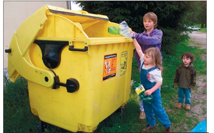
Grant je přímo určený na nové sběrné nádoby.

V grantovém programu je k dispozici velké množství peněz také proto, že přes tři miliony platí firma EKO-KOM. Ta podniká právě v oblasti zpracování a třídění odpadu a s krajem Vysočina má smlouvu o pilotním projektu, který se třídění odpadu týká. Má