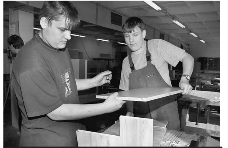
Odborné školy se učí připravit své žáky na praktický život. Své služby nabídnout mohou nabídnout i podnikům pro jejich zaměstnance.

Jeden z velkých projektů, který se bude o dotace z Evropské unie ucházet, je krajský záměr s názvem Adaptabilní škola. Střední odborné školy a střední odborná učiliště na Vysočině by podle něj měly změnit systém své práce, aby jejich absolventi získávali nejnovější poznatky o svém oboru, zároveň ale také praktický ná-