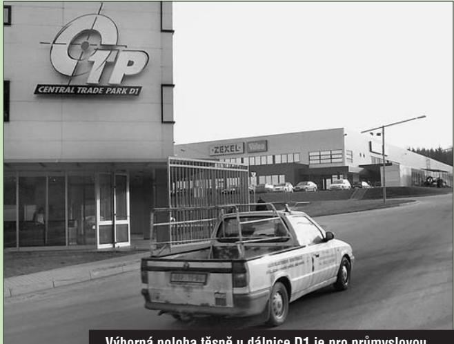
Výborná poloha těsně u dálnice D1 je pro průmyslovou zónu v Humpolci typická. Kraj chce ale ukázat investorům i další dobře připravená místa.

Ze současných 420 hektarů průmyslových zón je na Vysočině obsazena asi jedna třetina. Investoři mají zájem především o místa u dálnice D1, a tak jsou problémy například v Bystřici nad Pernštejnem nebo v Třebíči, která přitom trpí nejvyšší nezaměstnaností v kraji.