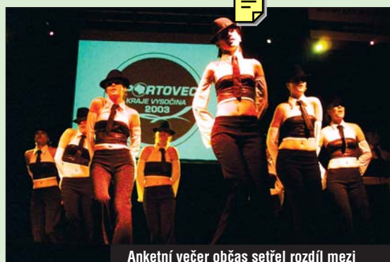
Anketní večer občas setřel rozdíl mezi sportem a uměním. Bylo se na co dívat.