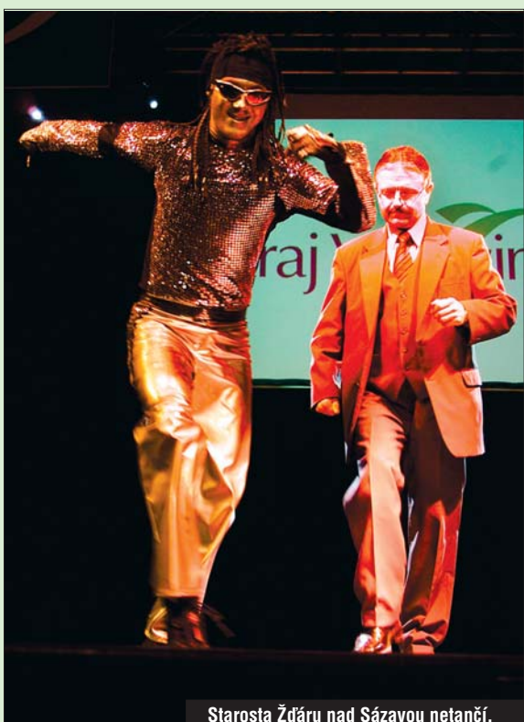
Starosta Žďáru nad Sázavou netančí, ačkoliv to tak vypadá. On zkrátka jde.