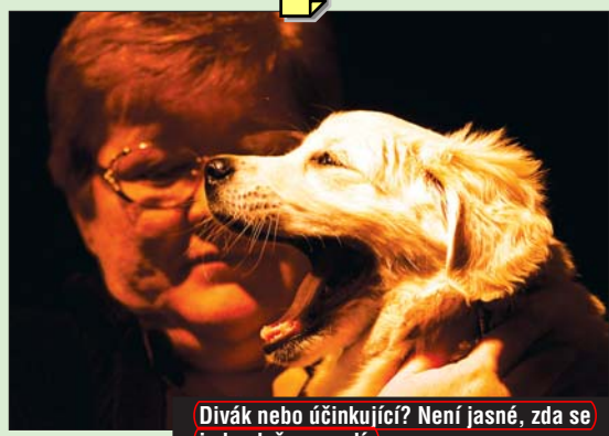
Divák nebo účinkující? Není jasné, zda se jednoduše nenudí.