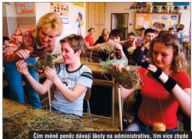
Čím méně peněz dávají školy na administrativu, tím více zbyde na kvalitní výuku.

ní a služeb v Novém Městě na Moravě, v Pelhřimově Střední odborné učiliště a konečně Gymnázium a Střední odborná škola v Moravských Budějovicích. Jednoho ředitele má mít na Třebíčsku také Střední zdravotnická, zemědělská a ekonomická škola a Vyšší zdravotnická a Vyšší odborná škola a Střední průmyslová škola a Střední odborné učiliště stavební.