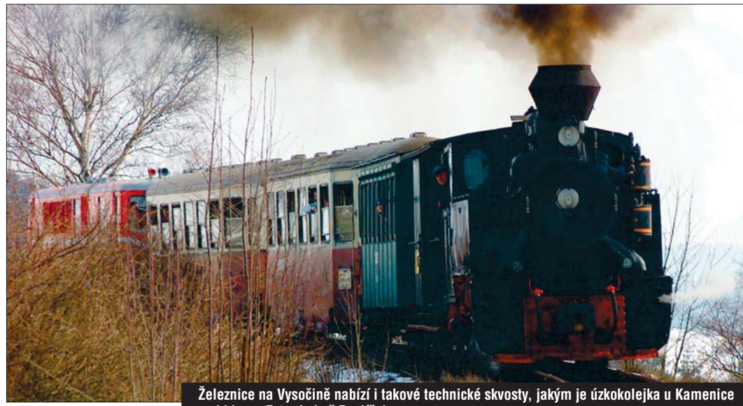
Železnice na Vysočině nabízí i takové technické skvosty, jakým je úzkokolejka u Kamenice nad Lipou.

objemu nákladní přepravy na koleje,“ dodal Pospíchal.