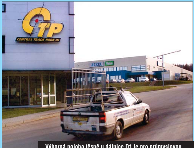
Výborná poloha těsně u dálnice D1 je pro průmyslovou zónu v Humpolci typická. Kraj chce ale ukázat investorům i další dobře připravená místa.

Ze současných 420 hektarů průmyslových zón je na Vysočině obsazena asi jedna třetina. Investoři mají zájem především o místa u dálnice D1 a tak jsou problémy například v Bystřici nad Pernštejnem nebo v Třebíči, která přitom trpí nejvyšší nezaměstnaností v kraji.