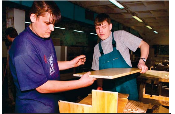
Odborné školy se učí připravit své žáky na praktický život. Své služby nabídnout mohou nabídnout i podnikům pro jejich zaměstnance.

Jeden z velkých projektů, který se bude o dotace z Evropské unie ucházet, je krajský záměr s názvem Adaptabilní škola. Střední odborné školy a střední odborná učiliště na Vysočině by podle něj měly změnit systém své práce, aby jejich absolventi získávali nejnovější poznatky o svém oboru, zároveň ale také praktický návod, jak se získanými dovednost-