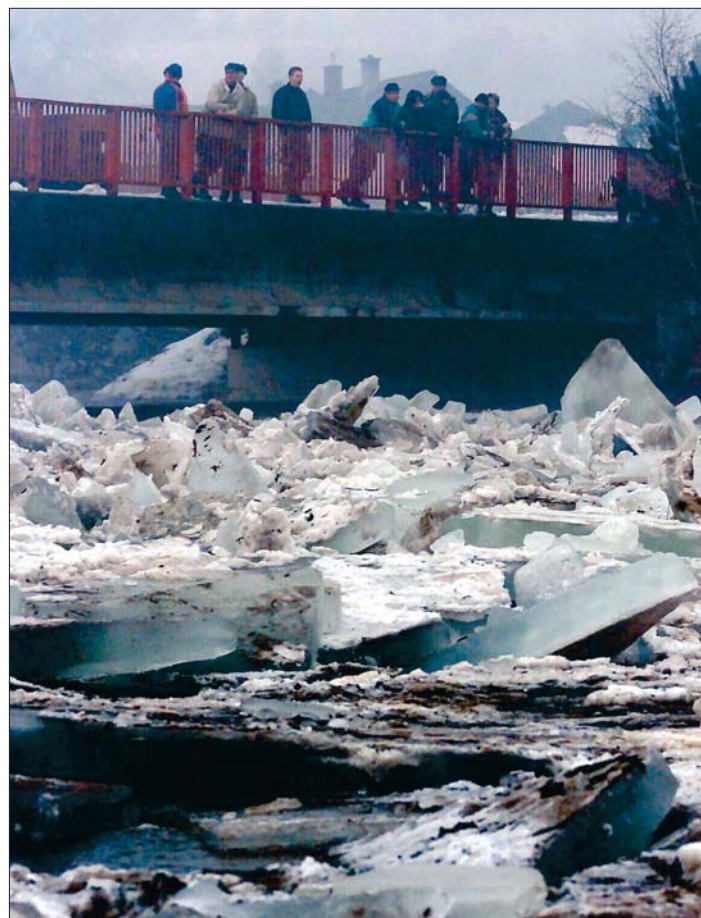
Zatím naposledy Svratka v Unčíně zahrozila počátkem února. Kry opět zatrasily koryto řeky a museli zasahovat hasiči. Místní lidé s napětím sledují řádění živlů.

Další možnou pomocí je grant, který by kraj na prevenci záplav vypsal. O něm se ale nyní spíše jedná a vzhledem k množství peněz, které má kraj k dispozici, připadá jeho vypsání v úvahu do příštího roku. Další změnou, která znamená obrát k lepšímu je zřízení povodňové komise přímo na Vysočině. Až do letoška totiž o záchranných pracích rozhodovaly komise podle povodní, to znamená prakticky ze sousedních krajů. Komise na Vysočině přitom může krizové řízení