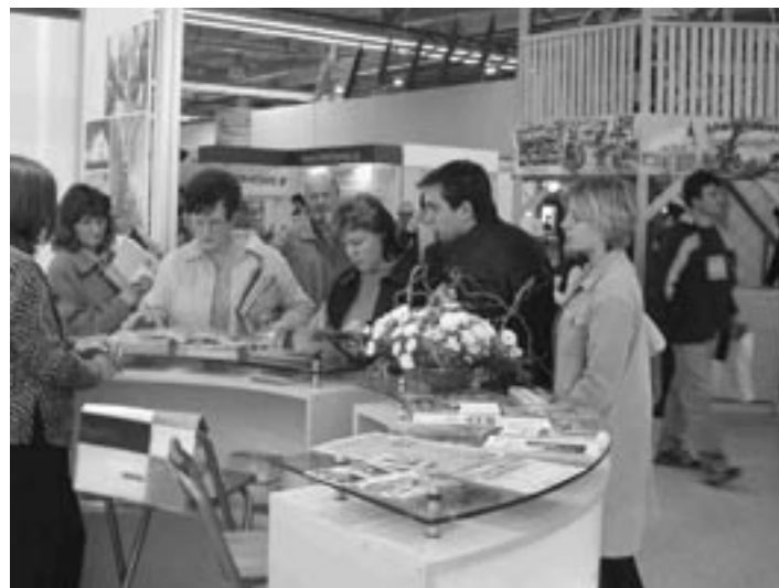
■ Stánek kraje Vysočina na veletrhu DOVOLENÁ 2004 v Ostravě

obou těchto veletrzích bude pověřen jediný dodavatel, aby byl zajištěn jednotný vizuální styl