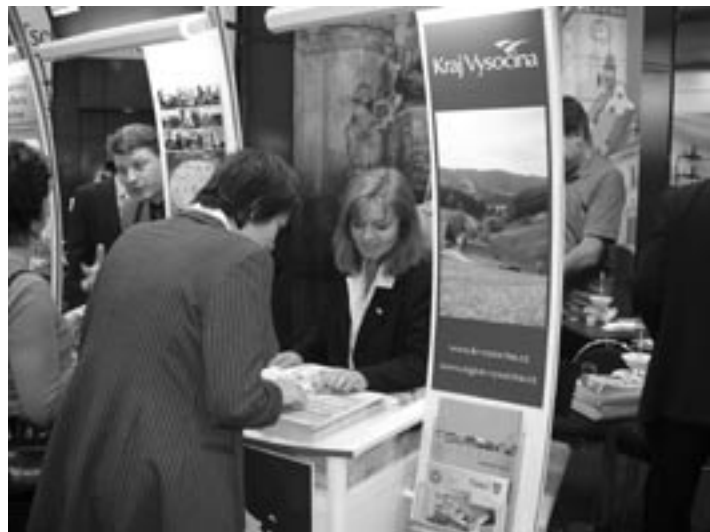
■ Prezentace kraje Vysočina na veletrhu v Lipsku

Na jednání zazněly poznatky o trvajícím nedostatku informací pro potenciální návštěvníky ze sousedních oblastí, a proto byly z dalších regionálních vý-