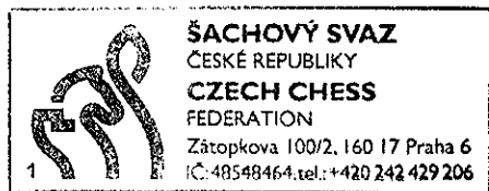
František Štross generální sekretář ŠSČR

Během extraligy hrály jednotlivé týmy své zápasy proti soupeřům v hracích místnostech domácích týmů, přičemž vždy vše zajišťoval domácí oddíl. Při Mistrovství ČR družstev mládeže hrají všechny týmy všechny zápasy na jednom místě, přičemž vše zajišťuje pořadatel mistrovství. Kromě jiného pořadatel zajišťuje on-line přenos partií i veškerý materiál a personál pro všechny zápasy.