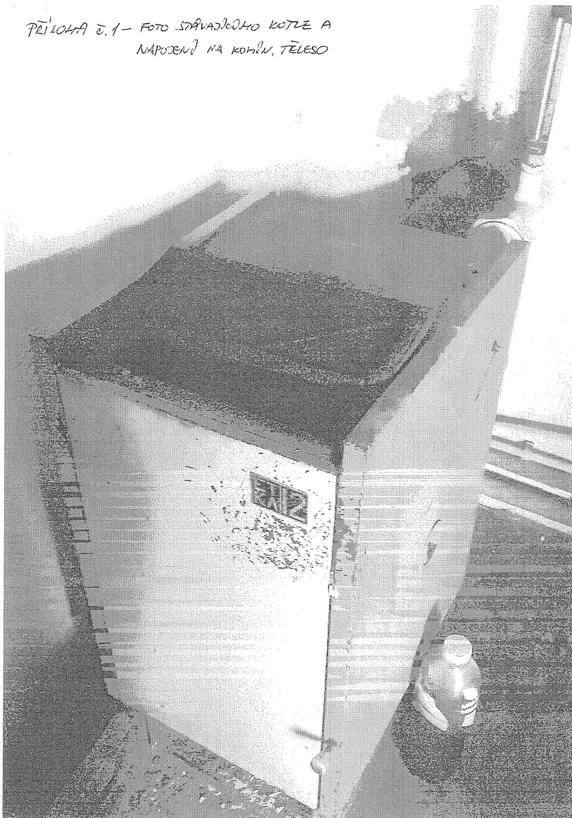
PŘÍLOHA č. 1 - FOTO STÁVAJÍCÍHO KOTLE A NÁPOJENÍ NA KOMP. TĚLESO