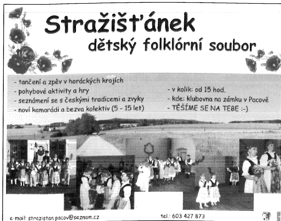
Obrázek 1: Plakát pro nábor dětí umístěn na webu, ve školách, školkách aj.