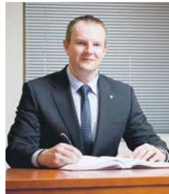
Martin Kukla (ANO 2011), náměstek hejtmána Kraje Vysočina pro oblast ekonomiky a majetku

Vánoce jsou tradičně příležitostí udělat si navzájem radost – maličkostmi očekávanými i překvapivými. Některé dárky udělají radost obzvláště početné skupině „obdarovaných“. Začátkem prosince Kraj Vysočina oficiálně předal do užívání zhruba stovku bytových míst v domově pro seniory v Havlíčkově Brodě, ještě před Vánocemi mohlo být i díky finanční podpoře Kraje Vysočina osazeno euroklíčem jedno z hygienických zařízení pro imobilní spoluobčany v areálu ZOO Jihlava a první Vánoce oslavili krajští muzejníci v nových prostorách zemědělské usedlosti na Cyrilometodějské ulici v Třebíči, kam se hned po Novém roce přestěhuje Centrum tradiční lidové kultury a jeho budoucí aktivity. „Obdarované“ instituce celoročně pečují nejen o naše pohodlí, vzdělanost a spokojené stáří, ale pracují v nich naši sousedé a známí. I pro ně budou letošní Vánoce díky dobře odvedené práci stavařů a projektantů „štedré“. Štedrost nesmíme zaměňovat za synonymum Vánoc, proto v Kraji Vysočina děláme vše pro to, aby štedrost ve veřejných krajem zajišťovaných službách byla znát po celý rok, aby z ní mělo prospěch co nejvíce lidí.