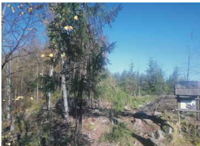
■ Náročná doba nouzového stavu a celé řady vládních opatření dává naši fyzické zdatnosti i psychické pohodě hodně zabrat. Ne nadarmo odborníci radí, abychom dostatečně spali a chodili na dlouhé procházky do přírody. Na Vysočině máme možnost spoustu krásných procházek může být například Naučná stezka Čeřinek na Jihlavsku, dlouhá šest kilometrů se 14 zastaveními, kde se seznámíte s živou a neživou přírodou Čeřinku.