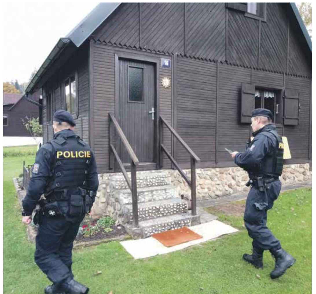
■ Policisté kontroly chatových oblastí a rekreačních objektů provádějí v nepravidelných intervalech v průběhu celého roku, ale v zimních měsících jsou intenzivnější.

Od letošního ledna do konce září řešili policisté na Vysočině celkem 33 případů vloupání do rekreačních objektů. Pachatelé