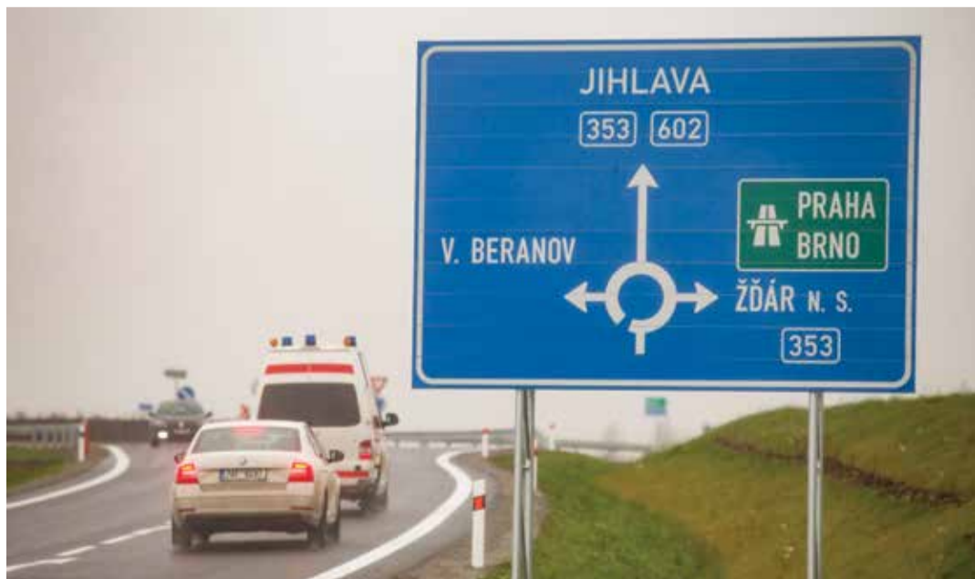
Už v prvních dnech si řidiči pochvalovali kratší a rychlejší cestování.