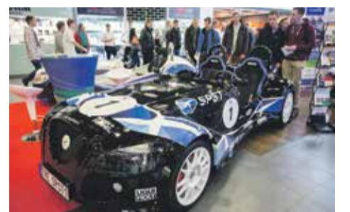
■ Sedm automobilů stavěly dvanáctičlenné týmy pod vedením mistrů odborné výuky. V dubnu 2016 byly všechny vozy k vidění v jihlavském obchodním centru Citypark.

V roce 2016 studenti sedmi krajských technických a odborných středních škol prezentovali vlastnoručně postavených 14 sportovních automobilů Kaipan v rámci projektu Postav si svoje auto. Někteří se sportůky dokonce ujeli kolem 300 kilometrů do slovenské Nitry, kde výsledek své práce představovali na výstavě středních odborných škol Mladý tvorec 2016 v partnerském Nitranském samosprávném kraji. V pozdějších letech pak studenti stavěli další sportovní auta, traktory, nákladní Tatru, elektrovozítka a ve školním roce 2019/2020 montují v dílnách Střední školy průmyslové, technické a auto-