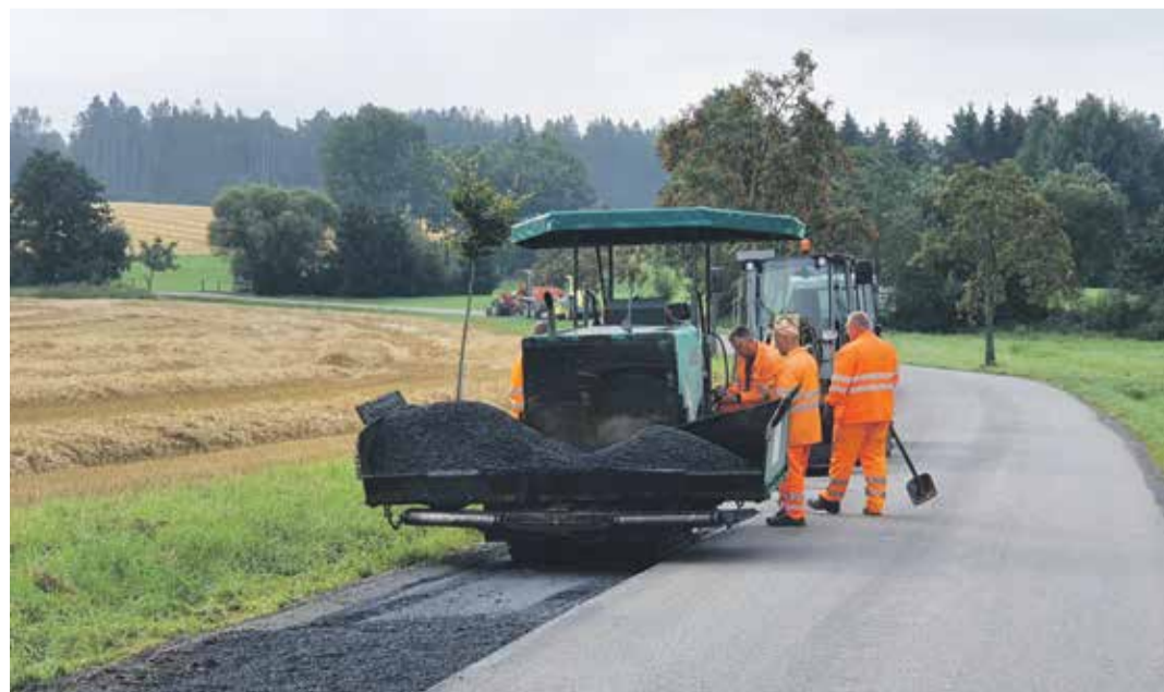
Informace o dokončených i probíhajících stavbách najdou lidé v aktualitách na www.ksusv.cz.