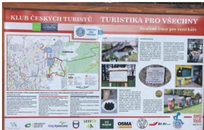
■ Tříkilometrový okruh se jmenuje Za Hliníkem do Humpolce.