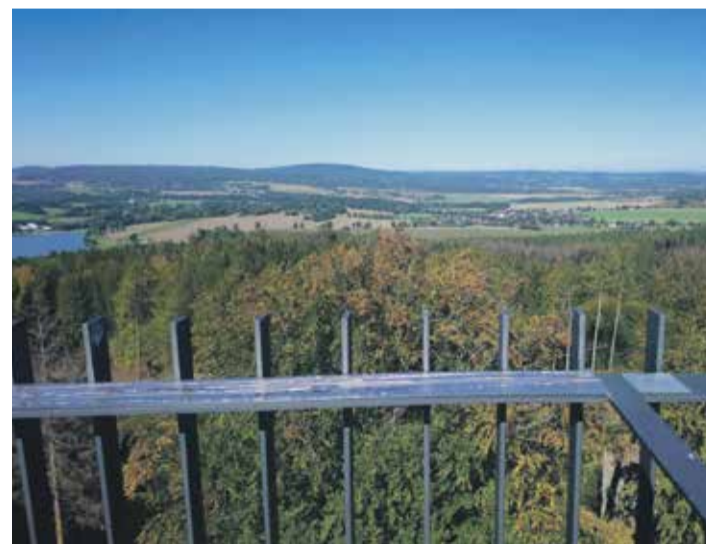
■ Na Vysočinu je i krásný pohled z výšky, v tomto případě z rozhledny na věži zříceniny hradu Orlík nad Humpolcem. I přesto, že se v lese pod hradem těží dřevo, procházka je to pěkná, absolvovat můžete i tamější devítikilometrovou Naučnou stezku Březina a seznámit se s geologií, historií a ekologií Humpolceka.