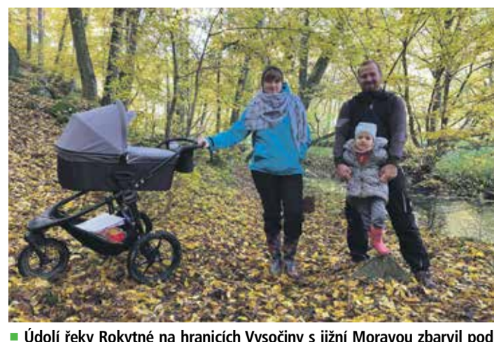
■ Údolí řeky Rokytne na hranicích Vysočiny s jižní Moravou zbarvil podzimem do pestrých barev. Projít se můžete krajem Vítězslava Nezvala po trasách tradičního pochodu Rouchovanské 25. Toto nepřilíží známé údolí lemuje skály a louky. Voda z řeky kdysi poháněla mlýnská kola. Na 40 km Rokytne dodnes stojí na 24 mlýnů. Z některých jsou už ruiny, jiné jsou přestavěné na rekreační objekty.