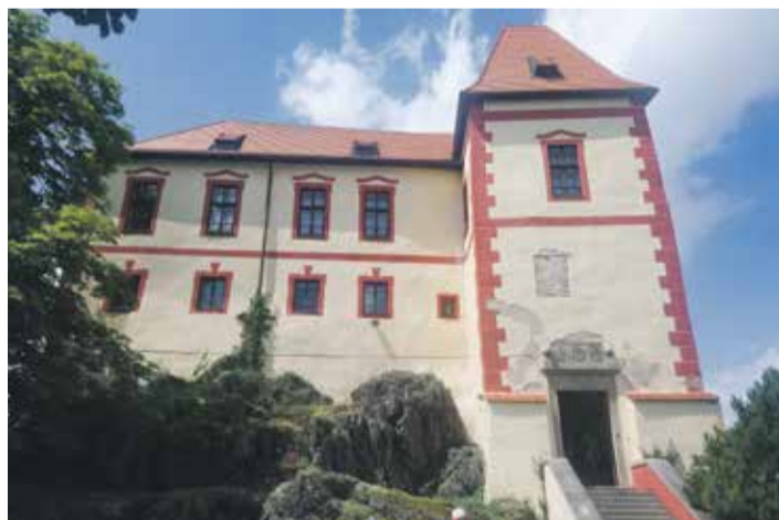
■ Studna je sedm metrů hluboká a metr a půl široká. Správa hradu plánuje vodou zalévat hradní park.

V rohu hradební zdi na hradě Kámen objevili archeologové sklep s valenou klenbou a středověkou studnu plnou vody. Tento nálezy je překvapil jednak proto, že o studni nikdo nevěděl, a také proto, že na tomto místě předpokládali skálu. Objevená studna je sedm metrů hluboká a metr a půl široká.