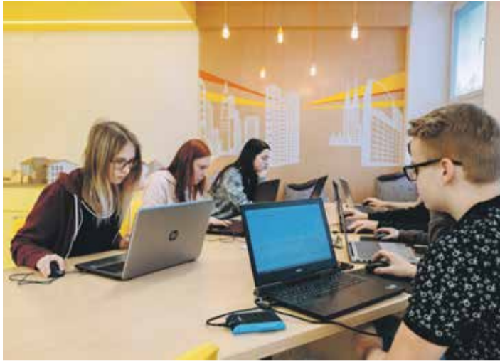
■ Moderní učebna architektury poskytuje studentům kvalitní zázemí pro studium.

Střední škola stavební v Třebíči, moderní škola s více než čtyřicetiletou tradicí, se stala významným centrem stavebního vzdělávání v Kraji Vysočina. Je určena všem, kteří se chtějí podílet na proměně krajiny, měst, obcí i interiérů v soukromých i občanských stavbách a chtějí se stát nepostradatelnými odborníky v oblasti stavebnictví. Současným ředitelem školy je Jiří Kurka. V denním studiu se ve škole vzdělává 430 studentů. Na vzdělávacím procesu se podílí 54 pedagogů. Žáci mají na výběr dva atraktivní studijní obory, čtyři nástavbové obory a devět učebních oborů. Velkou výhodou nabízených oborů je jejich vzájemná propustnost. Zájemce o vzdělávání nachází škola rovněž v řadách zaměstnanců partnerských firem. Škola se snaží neustále modernizovat interiéry a vybavení učeben. V příštím roce má v plánu kompletní rekonstrukci obou tělocvičen.