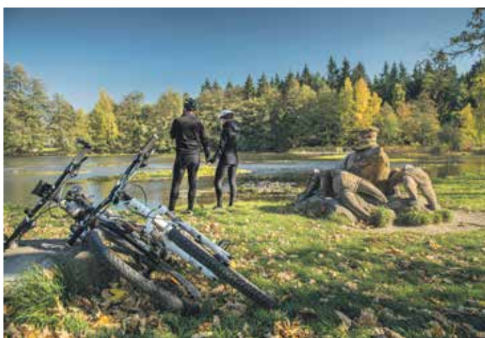
■ Hezké podzimní dny mohou posloužit i cyklistům. Rodiny s dětmi ocení betonové sochy Michala Olšiaka, které najdete převážně na Žďársku. Pěkná je 22kilometrová trasa z Polničky, k Pilské nádrži, rybníku Mikšovec, jezírku Vápenice, přes Račín (na fotce) až k rybníku Velké Dářko. Další tipy získáte na www.vysocina.eu .