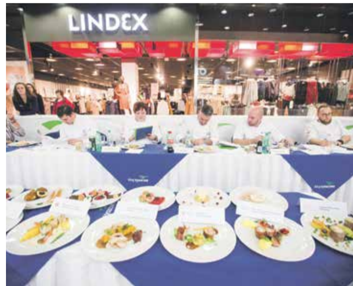
■ V porotě prvního ročníku soutěže Trophée Mille Česká republika zasedla česká kuchařská elita, mediálně známá a mezinárodně úspěšní čeští šéfkuchaři a cukráři. Hodnotili mimo jiného chuť, vyváženost, harmonii i samotný vzhled pokrmu.