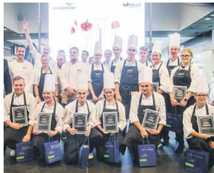
■ Připravit profesionální soutěžní pokrmy na veřejnosti pod dohledem tisíců návštěvníků Cityparku bylo pro mladé kuchaře náročné. Všichni výzvu zvládli skvěle a z Vysočiny si odvezli nově nabyté zkušenosti.