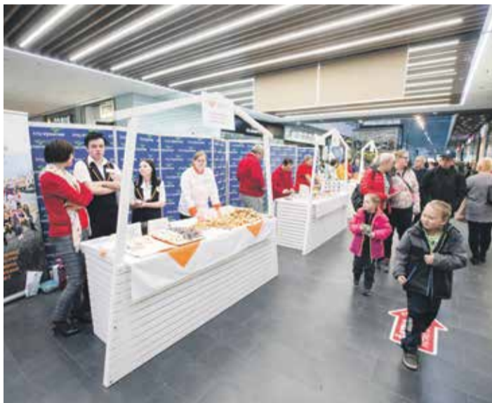
■ Součástí národního kola gastronomické soutěže byl i nabitý doprovodný program plný kuchařských show a své umění na stáncích prezentovali zástupci středních škol z Vysočiny.