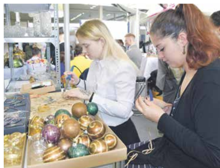
■ Vánočními ozdobami, skleněnými šperky a také vlastnoruční výrobou potaly pozornost studentky Akademie – Vyšší odborné školy, Gymnázia a Střední odborné školy uměleckoprůmyslové ze Světlé nad Sázavou.