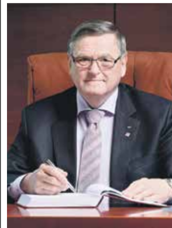
Jiří Běhounek (nez. za ČSSD) hejtman Kraje Vysočina