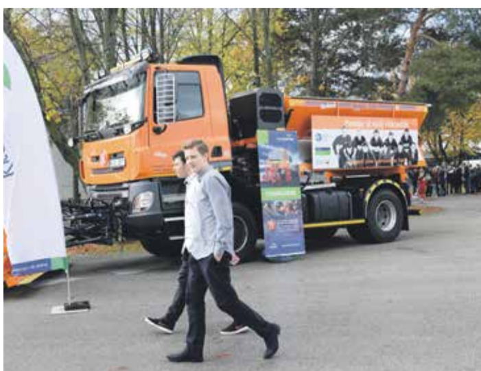
■ Návštěvníci veletrhu obdivovali oranžovou studentskou Tatru, postavenou žáky Střední průmyslové školy Třebíč. Ta mimochodem, stejně jako na Vysočině, budila obrovskou pozornost v centru Nitry, kterou projížděla s připevněnou sněhovou radlicí.