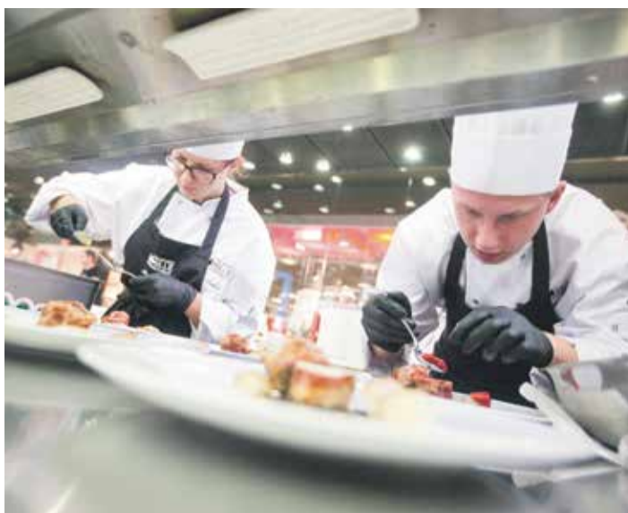
■ Osm dvoučlenných týmů ze středních hotelových škol z celé republiky připravovalo hlavní chod a moučník. Vařili přímo v pasáži obchodního centra a neměli nouzi o stovky přihlížejících kolemjdoucích.