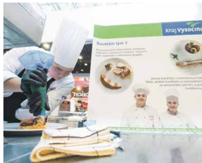
■ Na přípravu slaného a sladkého chodu měli studenti dvě hodiny, respektive 2:20. Pracovat museli s povinnými ingrediencemi, jako byl králíčí hřbet, brambory, farmářský tvaroh a med z Vysočiny.