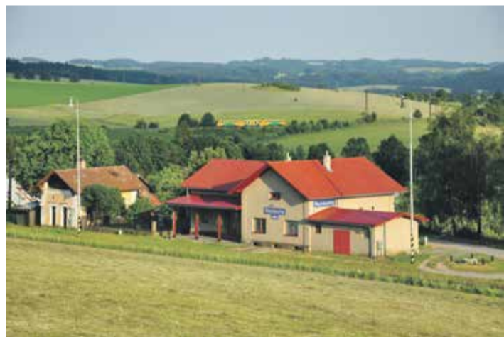
■ Pohled na Nejkrásnější nádraží roku 2019 v Rozsochách na Vysočině.

Titulem Nejkrásnější nádraží roku 2019 se od listopadu pyšní stanice Rozsochy nedaleko Bystřice nad Pernštejnem. Uspěla v konkurenci dalších 67 stanic z celé republiky, když z deseti finalistů získala více než 2 500 hlasů od veřejnosti. „Je čisté a s příjemnou atmosférou. V zimě se tu projevuje drsnější ráz krajiny, v létě se jedná o nejkrásnější místo na světě. Houkání vlaků je slyšet na kilometry daleko,“ dočtete se v soutěžním popisu na webu letošního ročníku soutěže. Nádraží leží u železniční trati 251 Žďár nad Sázavou – Nové Město na Moravě – Tišnov. První vlak tu projel 18. června 1905.