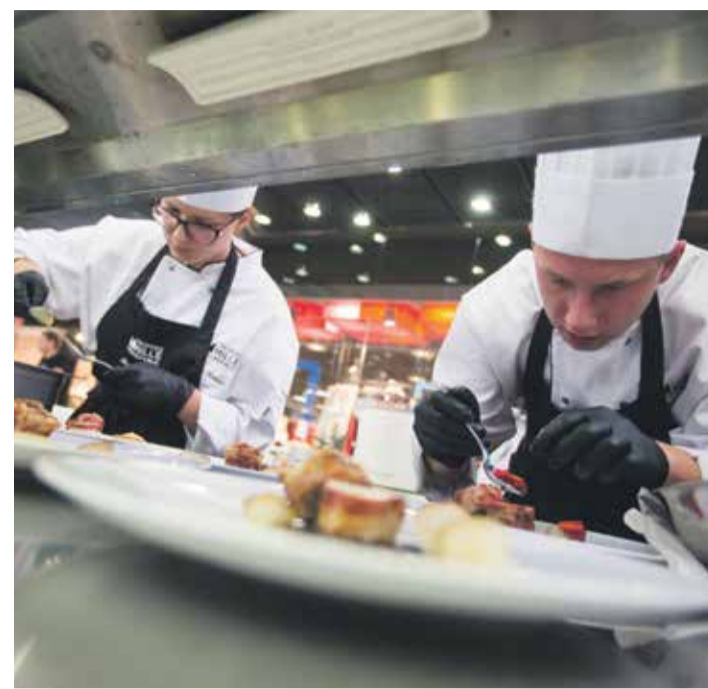
■ V loňském roce zvítězili studenti z Pardubic. Letos to třeba budou kuchaři z Vysočiny.

Soutěžící mají letos za úkol vymyslet co nejchutnější a neoriginálnější slavný a sladký pokrm za použití povinných