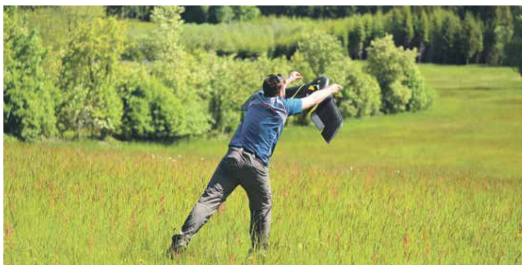
■ Za pouhých několik hodin dokázal dron nasnímat les Ochoza v areálu Vysočina Areny u Nového Města na Moravě.

Nové Město na Moravě se rozhodlo využít aplikaci Brouk, která s využitím nástrojů geoinformačních systémů podle certifikované metodiky pomáhá s včasnou detekcí napadených stromů. Za metodickým rámcem stojí odborníci z České zemědělské univerzity v Praze, za aplikací vyvíjejí ze společnosti Unicorn. „Loni jsme aplikaci vyvíjeli, od počátku letošního roku ji testujeme v praxi. Nové Město jsme oslovili, protože areál vzhledem k biatlonu známe, je v potřebně vyšší nadmořské výšce, takže se