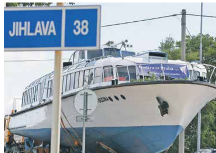
Týdny příprav a detailního plánování předcházely téměř 180kilometrové cestě lodi Vysočina na Dalešickou přehradu. V závěru června 2007 přijela z Podolska u Písku.