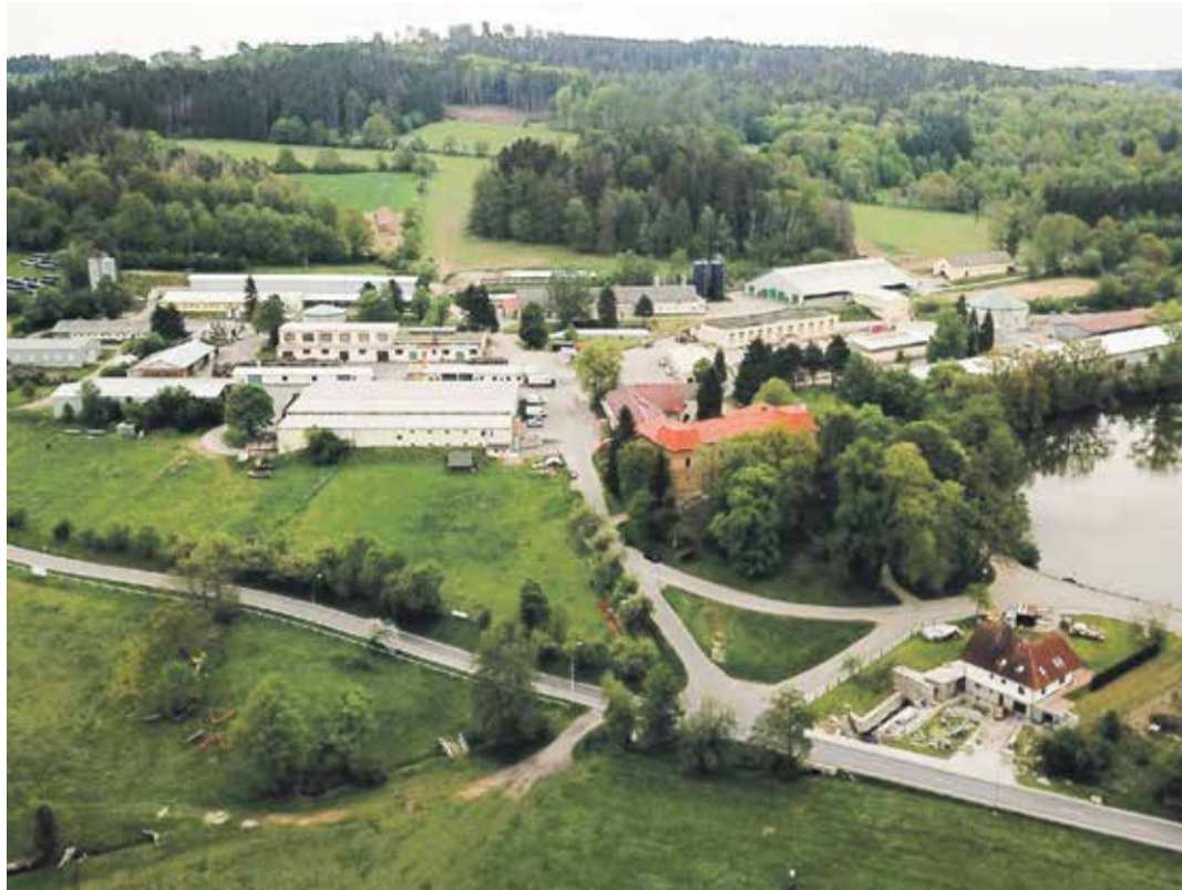
Pohled na školní statek z výšky.

Obhospodařují 780 ha zemědělské půdy, část tvoří louky a na orné půdě pěstují obiloviny, řepku, ale i brambory, krmné plodiny a množitelské porosty trav.