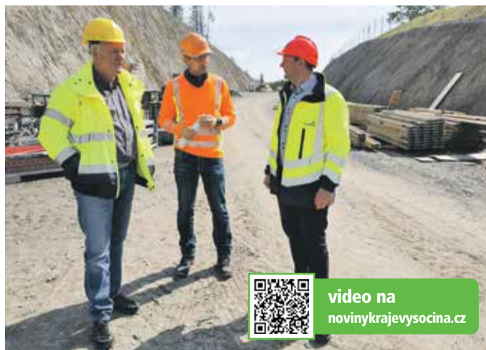
■ Přes čtyři kilometry dlouhý obchvat Velkého Beranova je zatím největší dopravní stavbou realizovanou Krajem Vysočina. Rozpočet přesahuje 800 milionů.