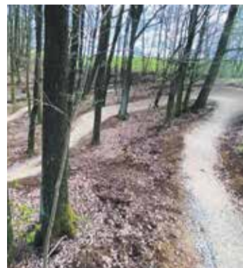
■ U Telče vyrostly singletraily pro horská kola.

Nejnovější upravené singletrailové trasy pro bikery s množstvím klopených zatáček a terénních vln se nachází u Telče. Tři kilometry zábavných stezek jsou postavené zejména pro děti a méně zkušené jezdce. V terénu jsou ale vyznačeny i alternativní odbočky, které jsou výzvou také pro zdatnější jezdce. Velice atraktivní je úsek s velkým skokem a přeletem přes potok. Areál navazuje na oblíbenou cyklo a inline stezku Lipky, ale traily slouží výhradně bikerům. Nechybí zázemí pro odpočinek. V okolí singletrailů vedou i značené cyklotrasy, kterými lze navázat na výlety po okolí, například směr hrad Roštejn.