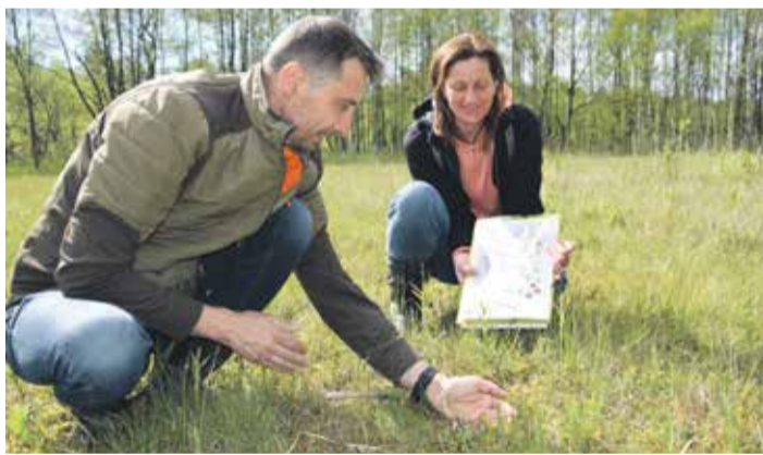
Nejpozoruhodnější rostlinou je třtina přehlížená, která roste v České republice pouze na dvou místech. Jedním z nich je významná lokalita v Lisovech na Vysočině.