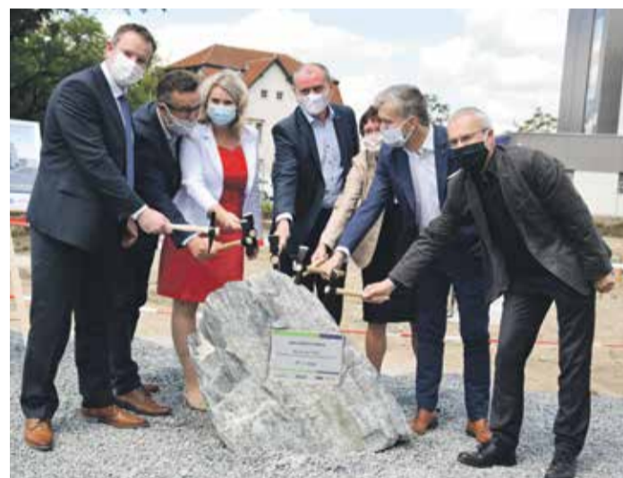
■ Koncem května zástupci nemocnice, Kraje Vysočiny a stavební firmy poklepali na základní kámen a symbolicky tak zahájili přístavbu a rekonstrukci pavilonu.

Stavební práce budou probíhat bez přerušení provozu v několika etapách. Přesně za rok budou předány čtyři hotové sály v nové budově, následně začne rekonstrukce staré budovy a v roce 2022 harmonogram prací počítá s předáním čtyř nových