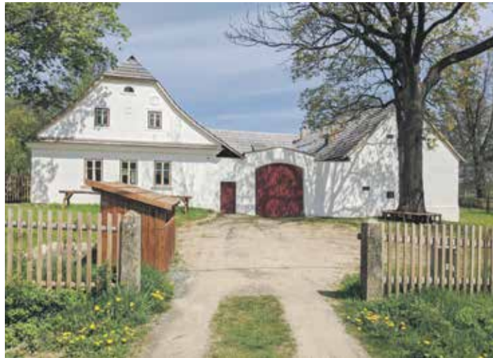
■ Dům přírody Žďárských vrchů.