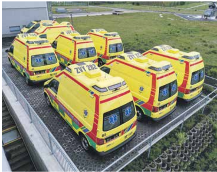
■ Flotila sedmi nových sanitních vozů Zdravotnické záchranné služby Kraje Vysočina.