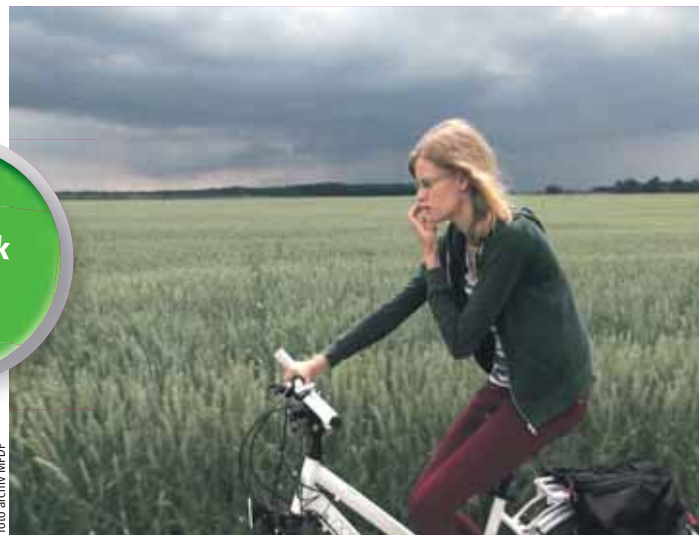
Dokument Normální autistický film režiséra Miroslava Janka získal ocenění za Nejlepší český dokumentární film 2016 společně se snímkem FC Roma.

V doprovodném programu figurovaly i besedy, odborné semináře, výstavy a divadelní i hudební vystoupení. „Věhlas a umělecká úroveň festivalu