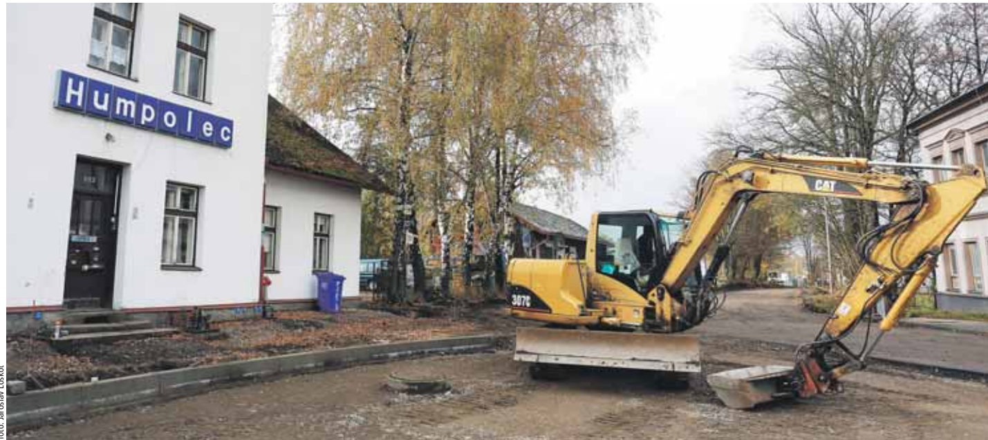
Rekonstrukce Lnářské ulice v Humpolci je jednou ze staveb, které budou dokončeny až v roce 2017.

Rok 2016 byl na Vysočině opět ve znamení zkvalitnění dopravní infrastruktury. Za opravy silnic II. a III. tříd kraj utratil přibližně jednu miliardu korun.