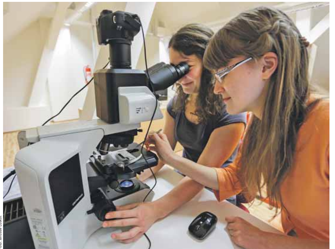
Studenti využívají moderní mikroskopy, ke kterým je přimontován i fotoaparát, a své poznatky tak mohou zdokumentovat.

i partnerské střední školy a základní školy, a to nejenom při studiu, ale také během kroužků. Stejně tak jsou přístupná účastníkům celoživotního vzdělávání, jako je tomu například na žďárském gymnáziu. Odborná střediska vznikla v rámci projektu Badatelská centra pro