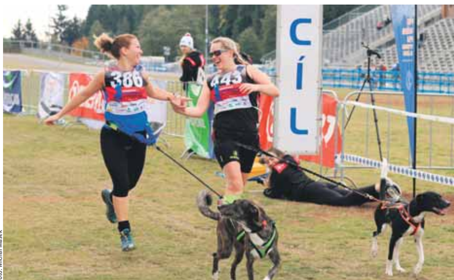
Mistrovství Evropy v canicrossu se v České republice konalo po osmi letech. Závod se konal na lyžařských tratích Vysočina Arény.