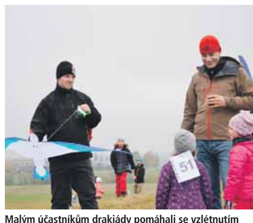
Malým účastníkům drakiády pomáhali se vzletnutím draka i jeho udržením na obloze rodiče.