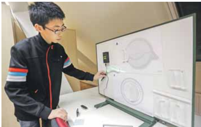
Pomůcka k výuce o lomu světla a dalších jeho vlastnostech.

Špičkově vybavené badatelsky slouží pro výuku fyziky, chemie, přírodopisu a další vědeckou činnost, čímž žáky středních škol připravují na práci s přístroji, s nimiž se později mohou setkat na univerzitě s přírodovědným zaměřením. Tato centra přitom mohou navštěvovat