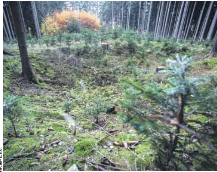
Stříbro se ve třináctém století netěžilo jen u Přibyslavi, ale také u Jihlavy, Havlíčkova Brodu nebo u Šlapanova.