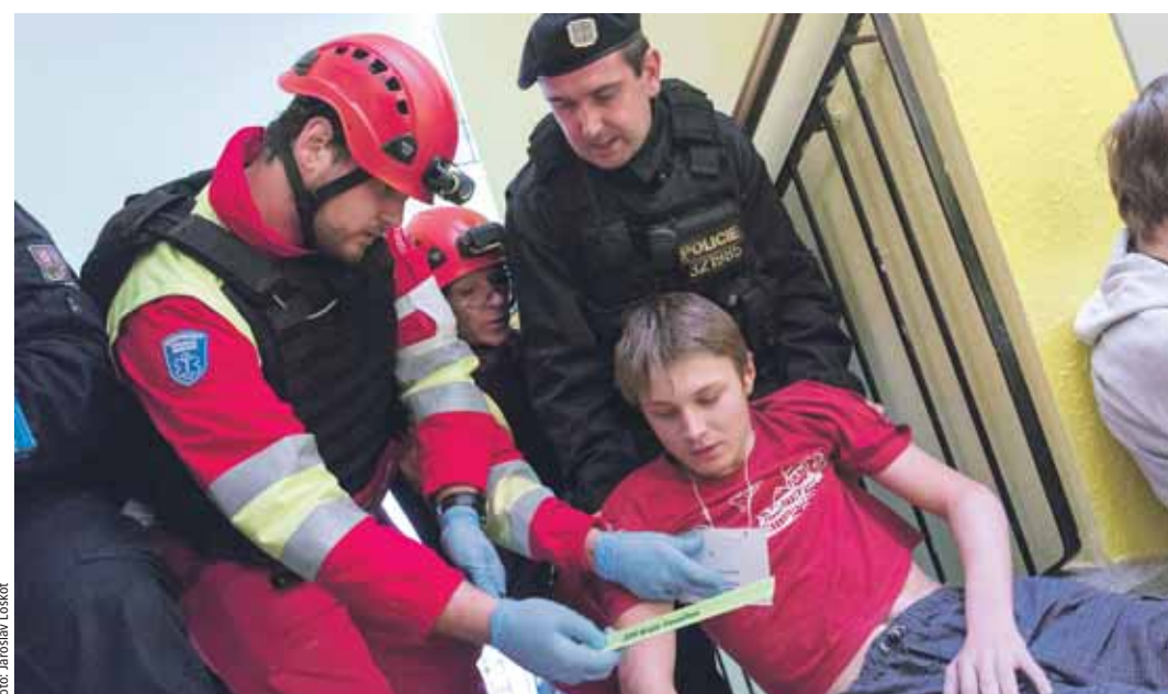
V úterý 25. října se v prostorách Střední průmyslové školy a středního odborného učiliště na ulici Friedova v Pelhřimově uskutečnilo taktické cvičení složek Integrovaného záchranného systému (IZS) AMOK – útok šíleného střelce.