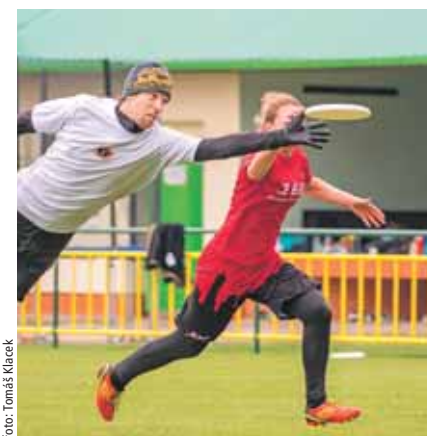
Frisbee je jedním z mála sportů, kde na hřišti soupeří smíšené týmy.

Finálový turnaj ovládly pražské celky. Zlaté medaile si z Tisu nakonec odvezl výběr Žlutá Zimnice, který v dramatickém finále přehrál svého konkurenta z hlavního města Terrible Monkeys těsně 15:13. Bronzové medaile vybojoval tým 3SB z jihu Čech. Jiří Svatoš