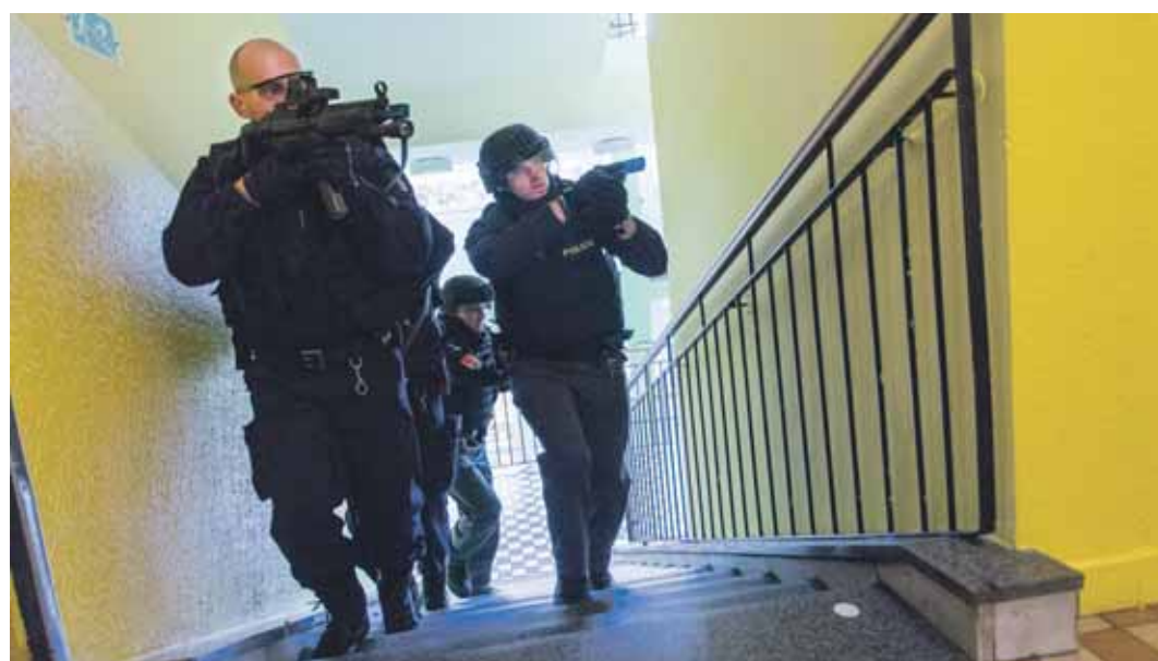
Taktické cvičení, jehož hlavním smyslem bylo prověřit spolupráci složek IZS Kraje Vysočina v podmínkách mimořádné události. Při ní došlo k násilnému útoku ozbrojence. Na místo dorazila i policejní zásahová jednotka, která měla útočníka zneškodnit, zatímco ostatní záchranáři evakovali a ošetřovali figuranty z řad studentů školy.