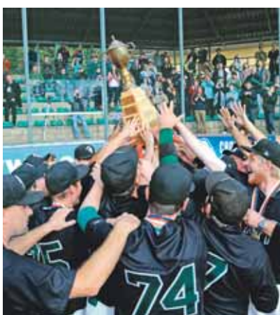
Závěrečný finálový zápas si v brodské Hippos Aréně nenechalo ujít asi 200 diváků.

Díky titulu mistrů republiky se Broďáci v příští sezoně znovu představí na Super Cupu – turnaji nejlepších softbalových týmů Evropy. Jiří Svatoš