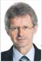
Miloš Vystrčil (ODS) zastupitel Kraje Vysočina, senátor