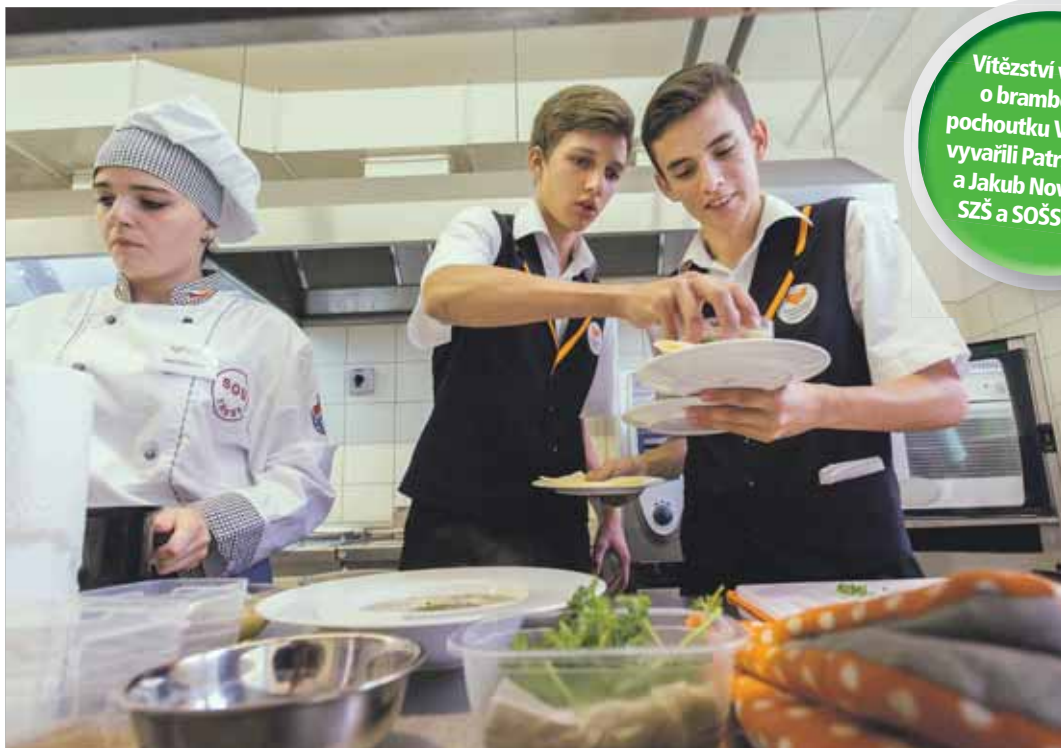
Studenti Obchodní akademie a Hotelové školy Havlíčkův Brod odnášejí soutěžní bramboračku před porotou soutěže o nejlepší bramborovou pochoutku.

„Letošní výnosy konzumních brambor jsou podle odborníků příznivé. Ve srovnání s minulým rokem, kdy se kvůli suchu výnosy propadly, je situace pozitivnější. Přeji vám, ať se i nadále daří a ať je resortu zemědělství věnována pozornost, kterou si zaslouží,“ uvedl při zahájení odborného semináře Brambory 2016 náměstek