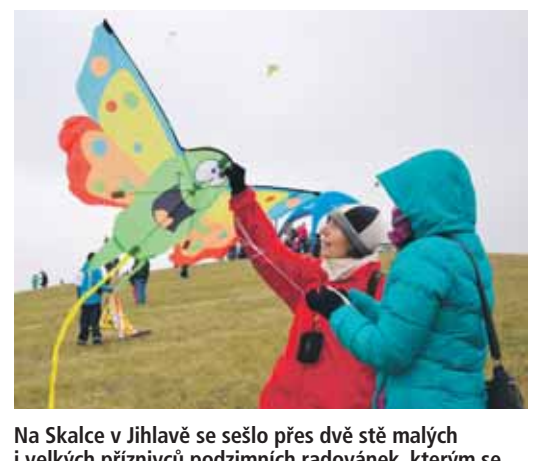
Na Skalce v Jihlavě se sešlo přes dvě stě malých i velkých příznivců podzimních radovánek, kterým se podařilo rozpohybovat na 60 draků.