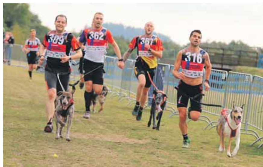
Psi musí být skvěle fyzicky připravení, zároveň ale musí být speciálně vycvičení. Důležité je především, aby poslouchali pokyny závodníků.