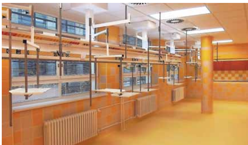
Expektační místnost novoměstské nemocnice zatím na nábytek, lůžka a přístrojové vybavení čeká.

text: Monika Fiedlerová