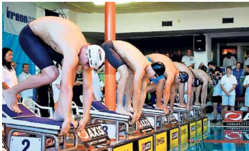
Plavecký bazén v ulici E. Rošického v Jihlavě ožil na počátku listopadu šestým pokračováním Českého poháru AXIS Cup 2012.

V těžké konkurenci se prosadili domácí závodníci, kteří získali třináct medailí, čtyři z nich byly zlaté.