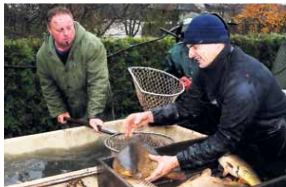
V Okrouhlici na Havlíčkobrodsku věnují místní hasiči po každém výlovu kapra vdovám po dobrovolných hasičích.

text: Ondřej Rázl