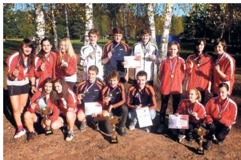
Novoměstští atleti se mohou pyšnit řadou úspěchů nejen z republikových závodů.