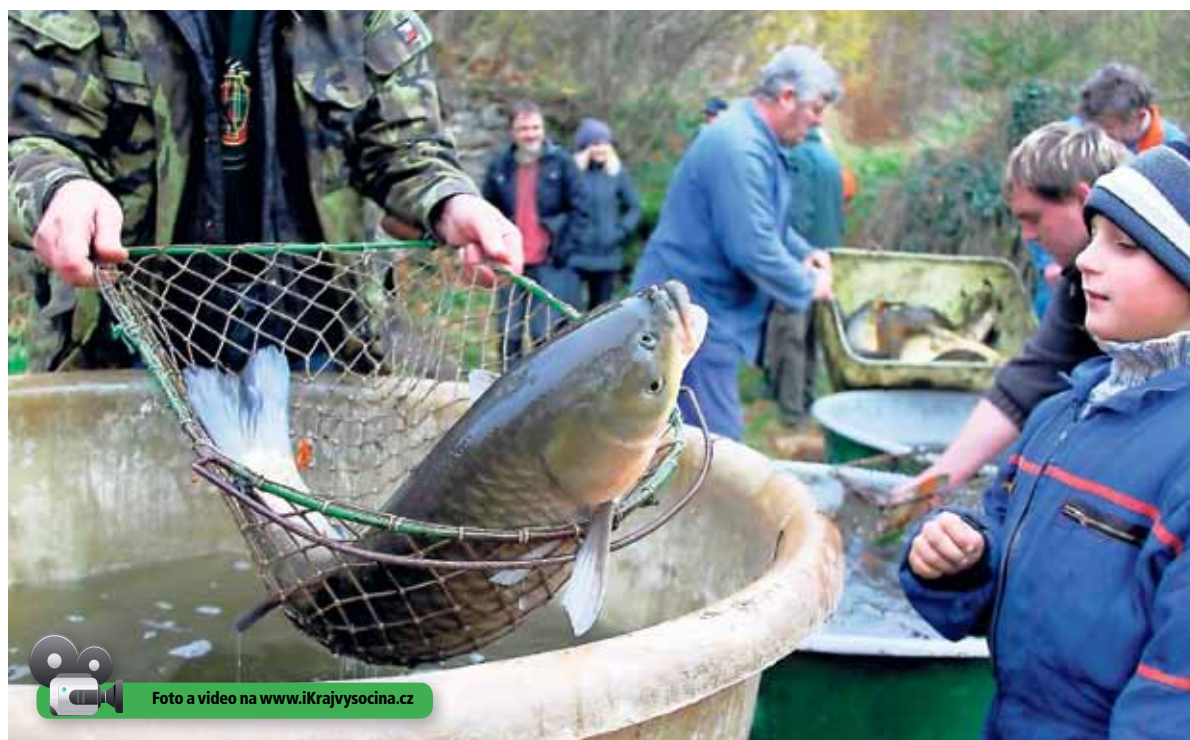
Kapr obecný je nejčastěji chovanou rybou v rybníciích Vysočiny, potvrdily to i letošní výlovy.