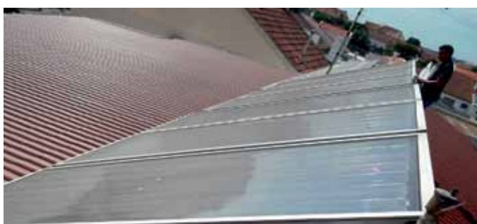
Studenti oboru energetika na praxi v Portugalsku

Další užitečné informace o škole mohou zájemci najít na webových stránkách www.spst.cz . Přímou do učeben, laboratoří a dílen je možné nahlédnout také v rámci DNŮ OTEVŘENÝCH DVEŘÍ. Uskuteční se začátkem příštího roku 16. ledna a 20. února 2013.