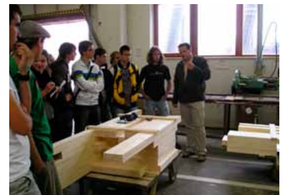
...navíc při výrobě oken ze dřeva to úplně jinak voní!