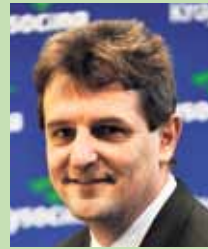
Libor Joukl náměstek hejtmána oblast dopravy a majetku kraje