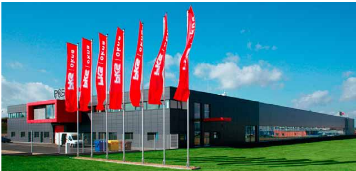
Výrobní hala PKS MONT, a.s.

Studenti SPŠ stavební z Havlíčkova Brodu přijíždějí již pravidelně dvakrát do roka – naposledy to byli v červnu studenti druhého ročníku technického lycea. I se zástupci učitelského sboru shlédli jak výrobní prostory PKS MONT, tak proces výroby oken, a všude se jim dostalo odborného výkladu od vedoucích pracovníků daných výrobních provozů. Ve stejném měsíci provoz navštívili studenti a učni