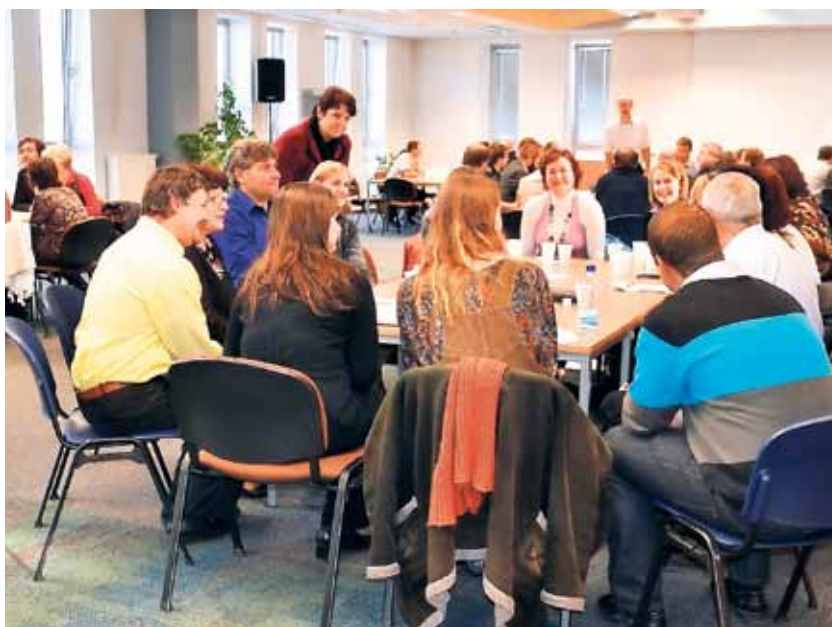
Sociální oblast byla na veřejném fóru zastoupena nepočtenými.

Dále to jsou prevence zdravotních problémů, snižování množství odpadů, zlepšení dopravní infrastruktury a snížení tranzitní dopravy, s čímž souvisí i dopravní obslužnost v regionu, na osmém místě skončily otázky realizace nakládání s odpady a na posledních