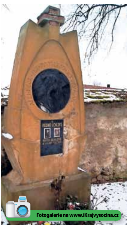
Náhrobek rodiny Jakuba Demla v Tasově.