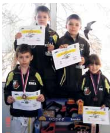
Mladí judisté Žďáru nad Sázavou po Velké ceně Veselí nad Moravou.