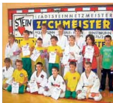
Úspěchy mladých judistů na turnaji v rakouském Hornu.