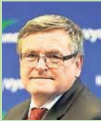
Jiří Běhounek hejtman oblast zdravotnictví, informatiky, krizového řízení a bezpečnosti