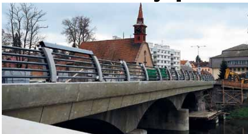
Most u kostela sv. Kateřiny v Havlíčkově Brodě budou řidiči moci využívat od poloviny prosince.

Práce na ulici Slovanského bratrství v Pelhřimově se zdržely kvůli výskytu velmi