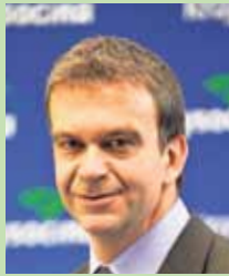
Vladimír Novotný náměstek hejtmána oblast financí, analýz a grantových programů