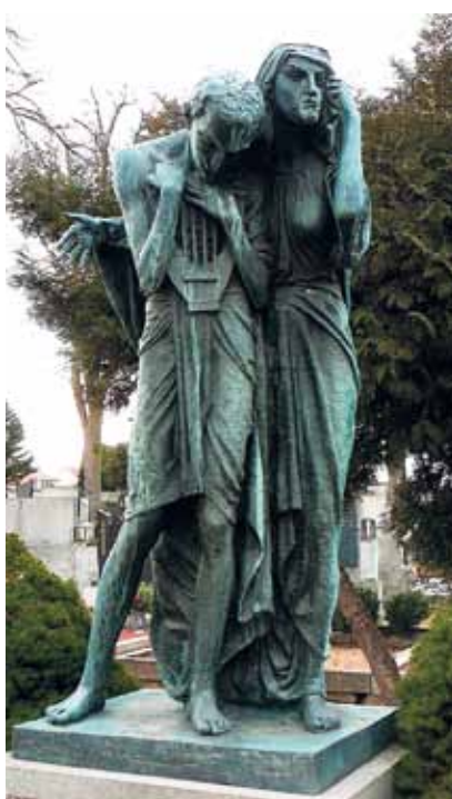
Tvůrce a jeho sestra Bolest v Jaroměřicích nad Rokytnou.

S kompletním Bílkovým dílem se můžete setkat na dvou místech – v nedávno rekonstruované vile v Praze na Hradčanech a v jeho letním sídle poblíž rodného domu