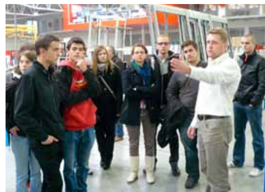
...než produkce z hliníkových profilů,...