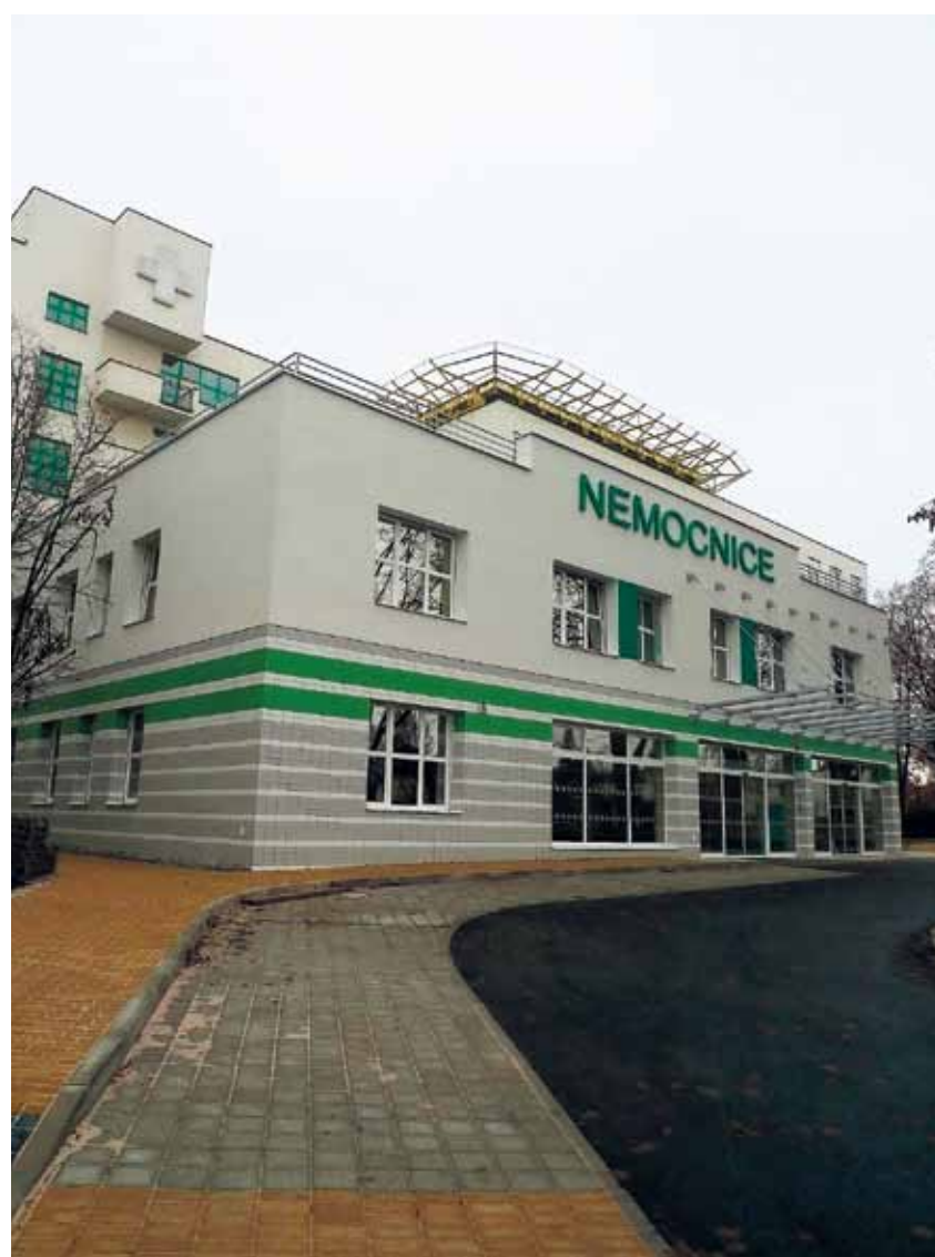
Vstup do nového objektu urgentního příjmu havlíčkovobrodské nemocnice.