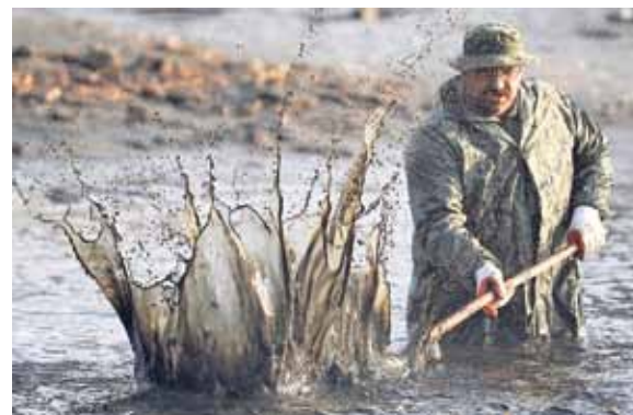
Hemžení ploutví, muži s podběráky, fascinující obrázky vodních gejzírů – neopakovatelná atmosféra podzimních výlovů.