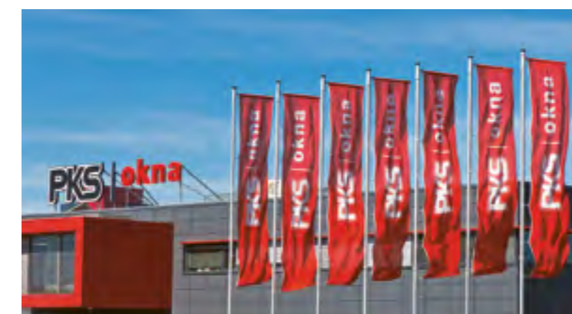
Výrobní hala PKS MONT, a.s.

Návštěvníci Dne otevřených dveří i oken začali v sobotu 9. června přicházet hned po deváté ráno. V 10 hodin již bylo parkoviště u vstupu do areálu PKS na ulici Jamská úplně zaplněné. A koho že to vítali vedoucí úseků, běžní pracovníci, ale také ředitel společnosti? Lidé, lidé z ulice, příbuzné pracovníků, jejich známé, nebo prostě „jen“ zvědavce. A děti. Spousty dětí. Tém se po celé dopoledne rozdávaly balonky a bonbonky. A taky se hrála loutková pohádka Princezna na hrášku, děti dováděly na skákacích atrakcích – skákací