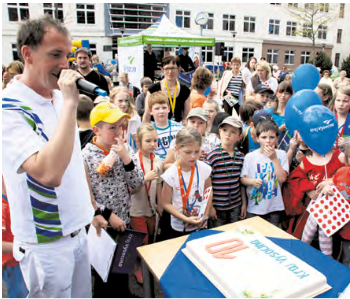
Jedna z mála fotek, na které je dort Dne otevřených dveří sídla Kraje Vysočina ještě celý.

Desátý ročník, stejně jako v předchozích letech, představoval práci úředníků a návštěvníci se mohli podívat do určitých částí krajského úřadu. Nechyběl ani příjemný kulturní program, který spojoval celou letošní tematiku. „Do tradiční akce jsme zapojili i několik novinek, úspěch sklídila taneční skupina seniorem Hodické kočky nebo jízda elektromobilem, hudbu zajišťuje skupina Mix