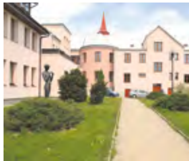
3 Senioři zpátky ve Ždírci Po rekonstrukci domova důchodců jsou v komfortnějším prostředí