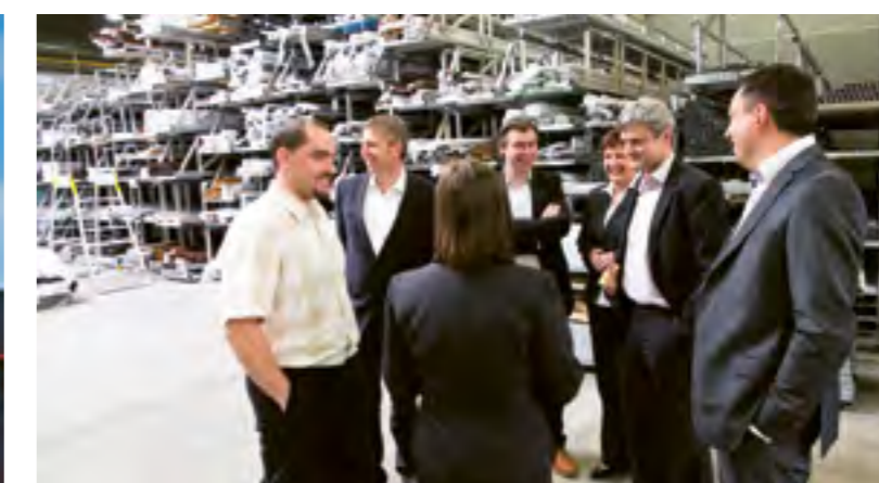
Návštěva v firmě Inoutic/Decueininc

A když už jsme u zájmu: účast na této dopolední akci byla skoro šest stovek lidí, včetně dětí, ale na to, že šlo o historicky teprve o 2. den otevřených dveří firmy, a vzhledem k tomu, že od rána až do oběda přišlo, je to solidní měřítko zájmu o firmu, která je pyšná na to, že patří