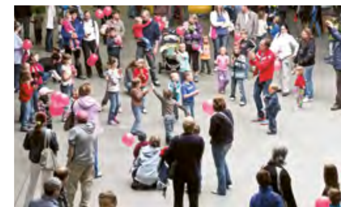
Rodiny s dětmi si přišly na své