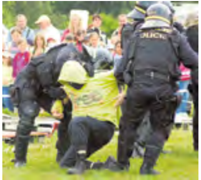
Policisté předvedli mimo jiné zásah proti agresivním demonstrantům.

Na programu byly divácky velmi atraktivní ukázky, jako např. zásah pořádkové jednotky proti agresivním „demonstrantům“. Velmi reálně vypadal zásah všech složek IŽS při simulované dopravní nehodě. Zajímavé byly i ukázky práce hasičů lezců nebo práce policijních psů. K vidění byli policisté na koních, letadlo hasičů požár ze vzduchu a divá-