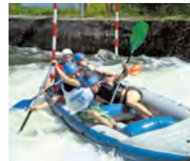
8 Želiv hostil mistrovství „Republika“ se na nejtěžším evropském kanále jela po šestnácté