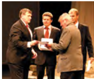
2 V Osově Bítýšce slavili Cenu hejtmána za Stavbu roku dostalo jejich Centrum pro kulturu