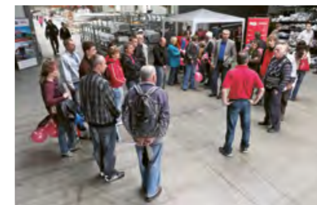
Prohlídka výrobní haly s výkladem