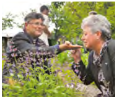
4 Více zahrad bez chemie Téměř padesát přírodních, dokonce „ukázkových“, za dva roky