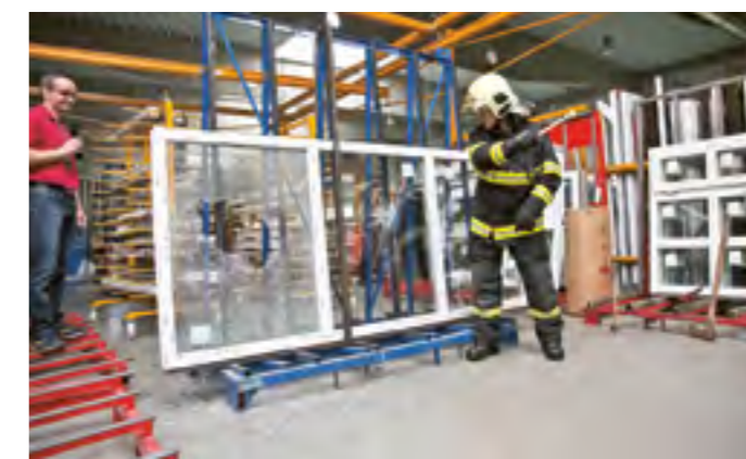
Zkouška odolnosti různých okenních skel