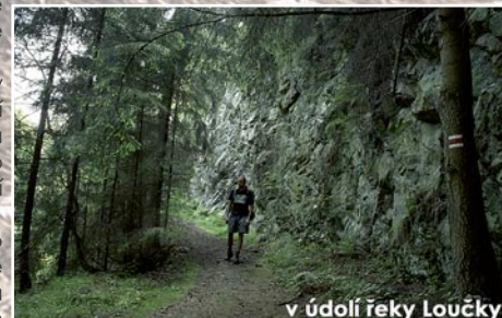
v údolí řeky Loučky

po 2,5 km na skálu s Trenckova rokle (372 m) . V roklí se podle pověsti údajně baron Trenck, který je pohřben v Kapucínské kryptě v Brně. Pár metrů před malý potůček, kolem kterého lze romantického žlebu. Potůček zde