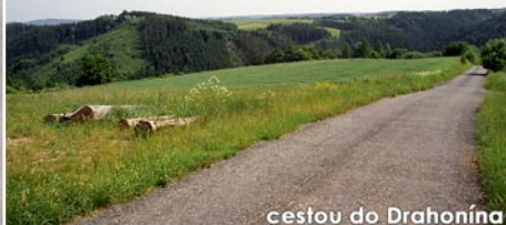
cestou do Drahonína