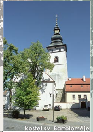
kostel sv. Bartoloměje