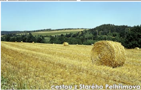
cestou z Starého Pelhřimova