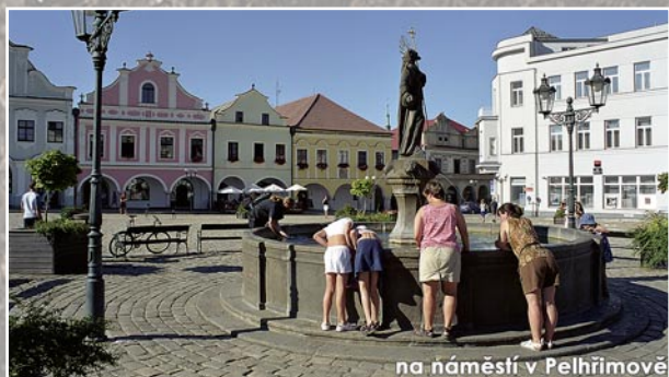
na náměstí v Pelhřimově

Galerie M Pelhřimov, Masarykovo náměstí 17, tel. 565 321 548, út-pá 9-12, 12:30-17, so 10-12, 12:30-17, ne 14-17