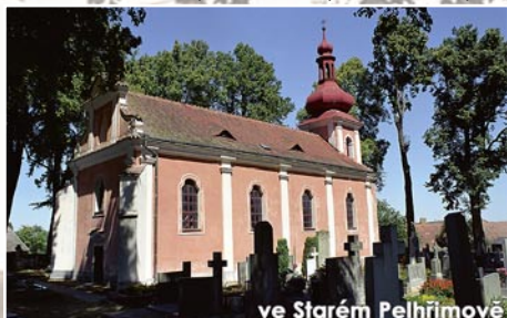
ve Starém Pelhřimově