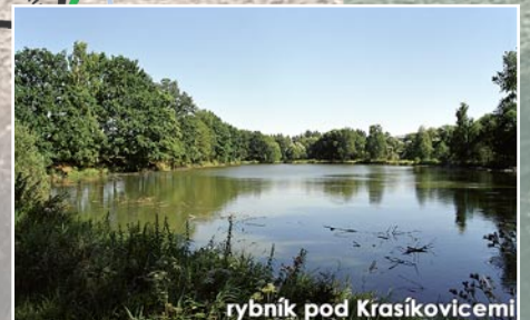
rybník pod Krasikovicemi