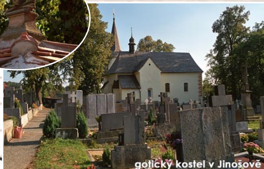
gotický kostel v Jinošově