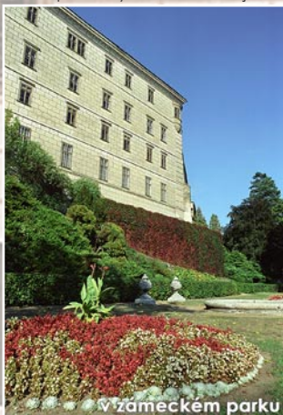
v zámeckém parku

V historickém centru pozornost renesanční stol., barokní kostel s obrazy holandských sousedství je fara plastikami ve Naproti kostelu stojí brněnské sochaře Oslavu, který patří Moravě. Má pět umělecké hodnoty. Z Náměště se Památník Bible Vám doporučujeme krásným smíšeným Brno.