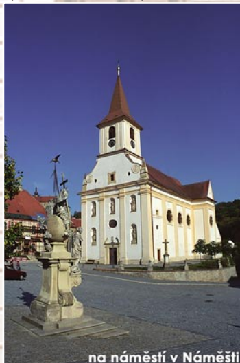
na náměstí v Náměšti