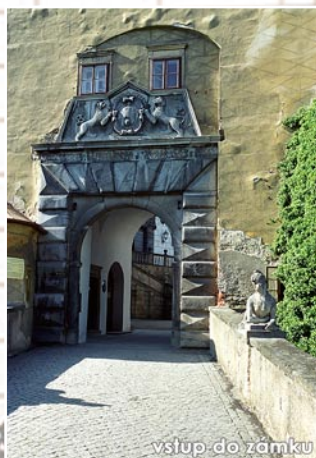
vstup do zámku

města je hradu, s renesančními budovami s bohatou je vyhlídková