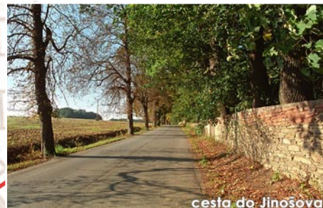
cesta do Jinošova