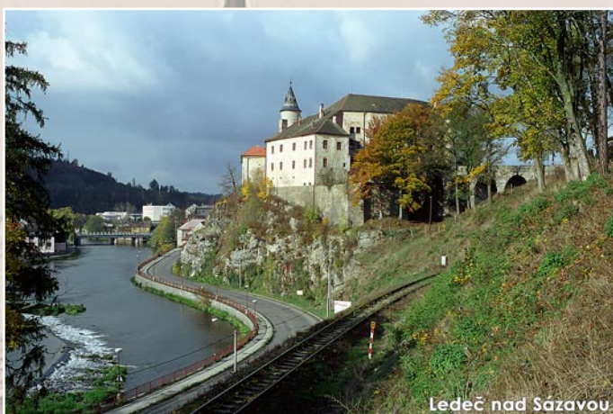
Ledeč nad Sázavou

Během jednoho dne navštívíme tři klenoty Posázaví. Hrad v Ledči nad Sázavou, historické centrum a zámek v Světlé nad Sázavou a na závěr majestátní hrad v Lipnici nad Sázavou.