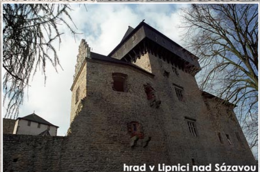
hrad v Lipnici nad Sázavou

Na závěr navštívíme jeden z nejmohutnějších hradů v Čechách – Lipnici nad Sázavou , který je postaven na výrazné vyvýšenině a skalisku a výrazně vyčnívá nad okolní terén. Proto je i místem dalekých rozhledů. Postaven byl pravděpodobně na počátku 14. stol. a měl chránit obchodní cestu z Havlíčkova brodu do Humpolce. Na severozápadní straně