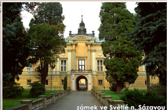
zámek ve Světlé n. Sázavou