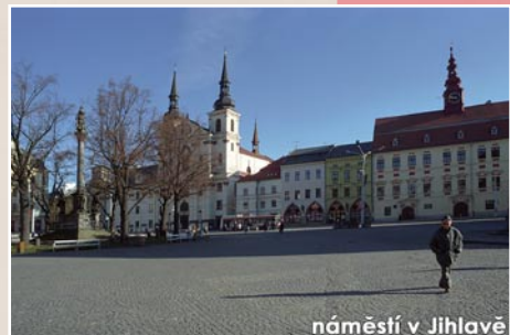
náměstí v Jihlavě