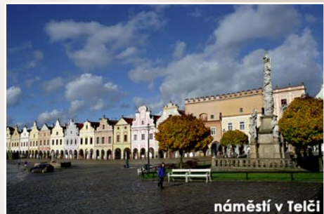
náměstí v Telči

Prohlídky denně: III-VI v 10, 11, 12, 14, 15 a 16 hod, VII-VIII v 9, 10, 11, 12, 14, 15, 16 a 17 hod, IX-X v 10, 11, 12, 14, 15 a 16 hod. XI-XII 10, 11, 12, 14, 15. V prosinci je zavřeno v vánočním období. Mimo uvedenou dobu pro skupiny na základě objednávky: Občanské sdružení Jihlavský netopyr, Masarykovo nám.64, tel.