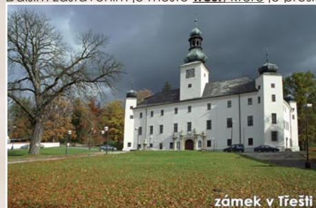
zámek v Třešň