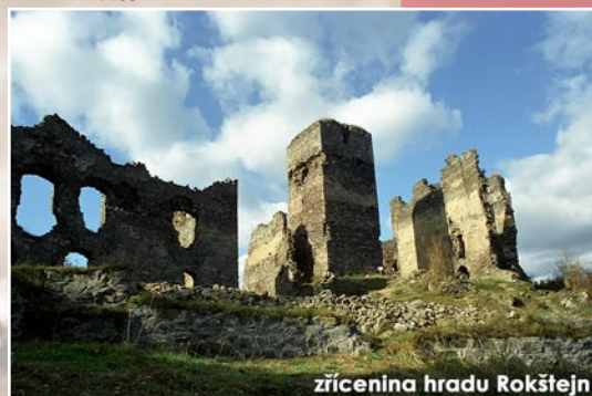
zřícenina hradu Rokštejn