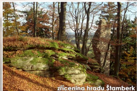
zřícenina hradu Štamberk