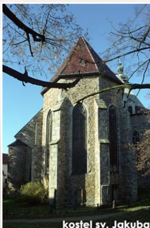
kostel sv. Jakuba