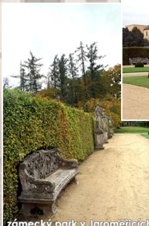
zámecký park v Jaroměřicích