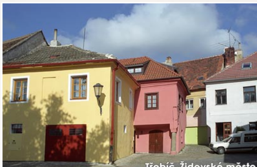
Třebíč židovské město