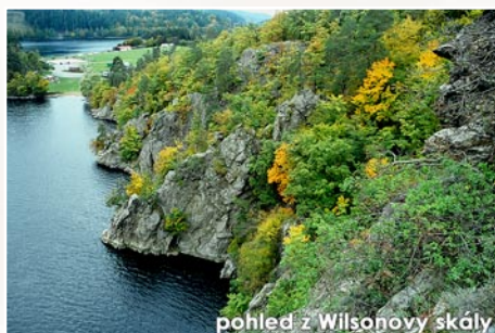
pohled z Wilsonovy skály