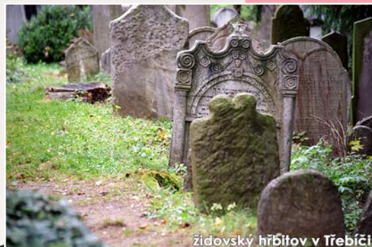
židovský hřbitov v Třebíči