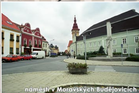
náměstí v Moravských Budějovicích