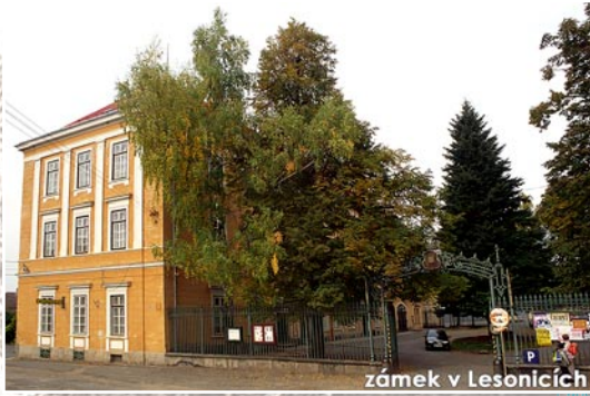
zámek v Lesonících