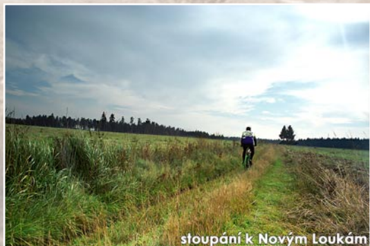
stoupání k Novým Loukám

Zde opět opustíme turistické značky a pojedeme po silnici č.512 směrem Sádek a Stařeč. Po 1 km stoupání začneme klesat k Sádeckému rybníku. Projedeme po hrázi a po chvíli přijdeme na křižovatku ve tvaru T, kde odbočíme vlevo nahoru. Po 100 m přijdeme k Sádek , kde můžeme odbočit vpravo a vystoupat po žluté 500 m /3/ alejí a lesem k hradu Sádek . Přestože nyní slouží jako základní škola, zachoval si rysy středověké pevnosti obehnané hradním příkopem /doporučujeme prozkoumat spleť cestiček kolem hradu/. Uvnitř byl přestavěn na renesanční zámek. Pak se vrátíme zpět a pokračujeme po žluté směrem Horní hora. Jeden kilometr pojedeme ještě po silnici a pak z ní odbočíme vlevo na lesáckou cestu a stoupáním /2/ po 3 km přijdeme na vrchol a Horní hory . Dál pokračujeme se žlutou po hřebeni v hustých smíšených lesích. Po 1,5 km se od nás odloučí žlutá vpravo a my budeme pokračovat dále po asfaltce až přijdeme k silnici č. 410. Zde odbočíme vlevo a sjedeme dolů do Rokytnice , kde náš výlet začal.