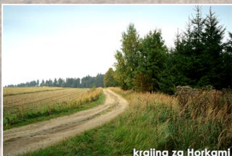
krajina za Horkami