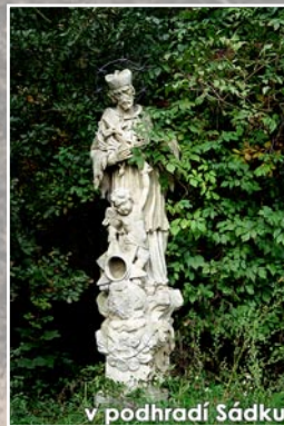
v podhradí Sádku