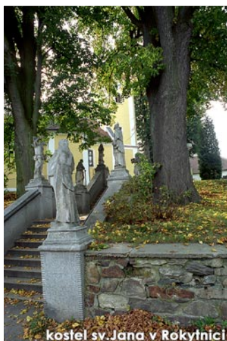
kostel sv. Jana v Rokytnici

Z Rokytnice nad Rokytnou hustými lesy až k Želetavě. Jízdou skrze divoké a opuštěné údolí Žlabského potoka přijdeme do Lesonic. Dál pojedeme přes pole a louky kolem vesniček a rybníků, až přijdeme k hradu Sádek. Závěr trasy opět patří hustým lesům a vrcholu Horní hory.