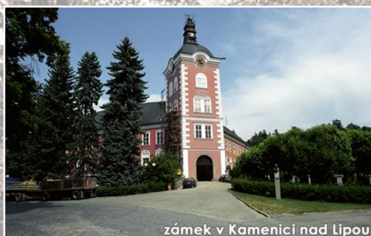
zámek v Kamenici nad Lipou

Rekreační středisko Baráčnická zotavovna, Pacovská 147, 394 94 Černovice, tel. 565 492 320 Ubytovna, Dobešovská 590, 394 94 Černovice, tel. 565 492 183