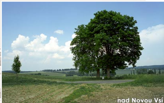
nad Novou Vsí