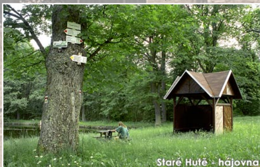
Staré Hutě - hájovna