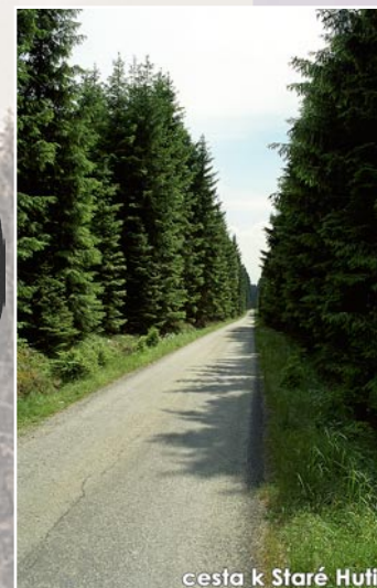
cesta k Staré Hutě