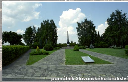
památník Slovanského bratrství