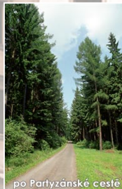
po Partyzánské cestě