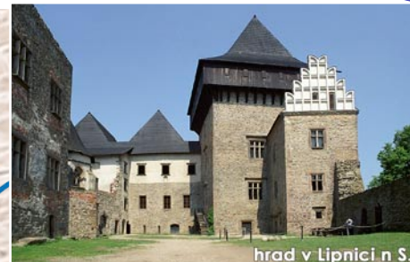
hrad v Lipnici n. S.