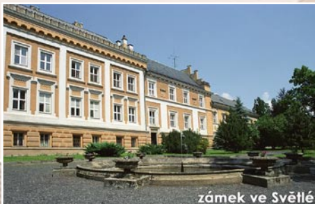
zámek ve Světlé