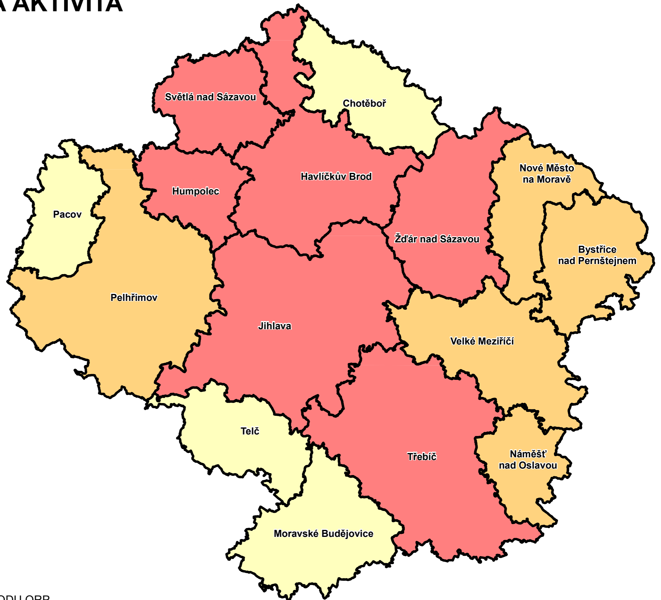
PODÍL EAO V TERCIÉRNÍM A PRIMÉRNÍM SEKTORU (2001)